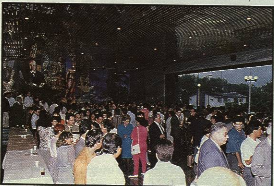
Aspecto parcial de los participantes al Foro, durante los diferentes eventos programados y en el coctel de clausura.