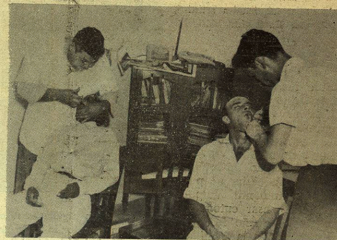
... se han propuesto llegar hasta los lugares más apartados del Estado, con el positivo mensaje de sus servicios ...

sible, fijarlas como una responsabilidad intransferible en el ánimo de todos los estudiantes Neoleoneses. Sus recursos han sido raquíuticos pero suficientes para realizar las primeras ocho MISIONES UNIVERSITARIAS y cuatro Exploraciones en las entidades Municipales que en seguida se enumeran: