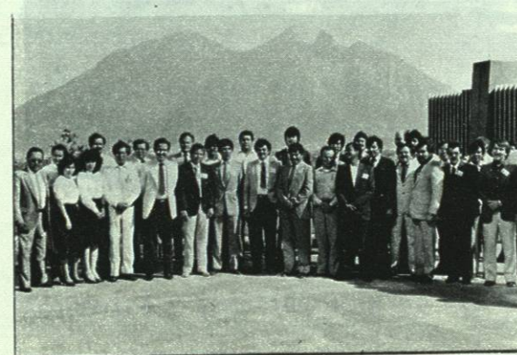
PARTICIPANTES EN EL CAPITULO DE INFORMATICA DE ANFECA.