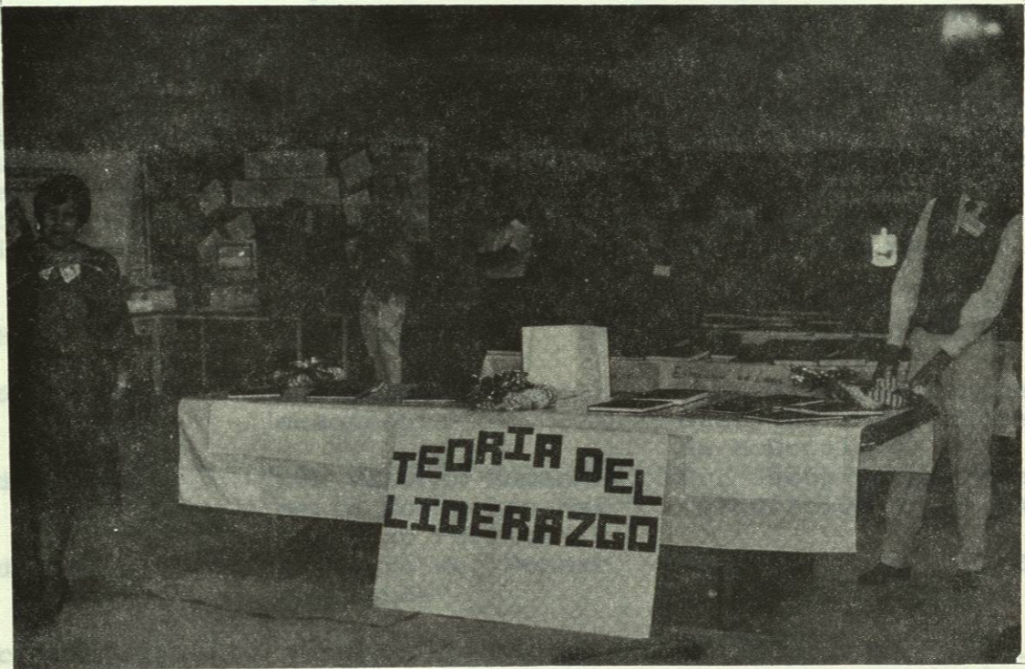
ALGUNOS DE LOS STANDS QUE CONFORMARON LA IV GALERIA REALIZADA POR ESTUDIANTES DE POST-GRADO.

CAPILLA ALFONSO... BIBLIOTECA UNIVERSITARIA