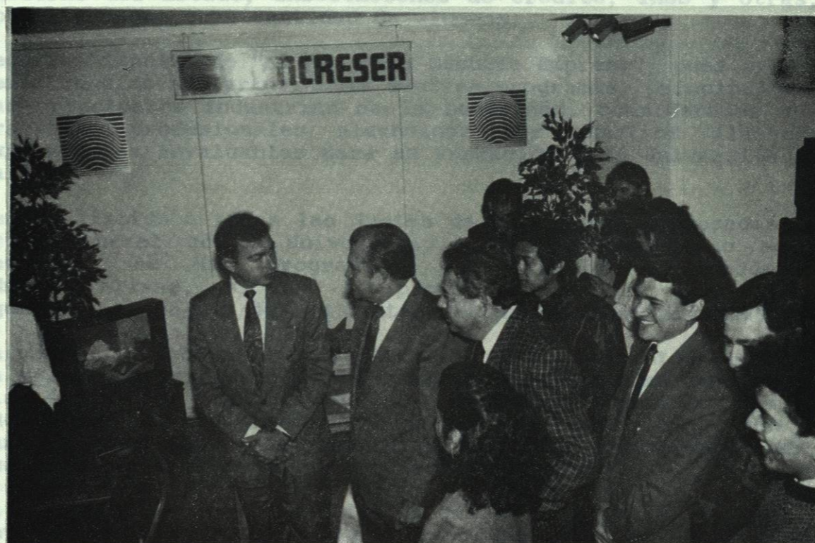
STANDS DE UNA DE LAS INSTITUCIONES DE CREDITO QUE PARTICIPARON EN LA "BANCA MODERNA Y F.A.C.P.Y A".