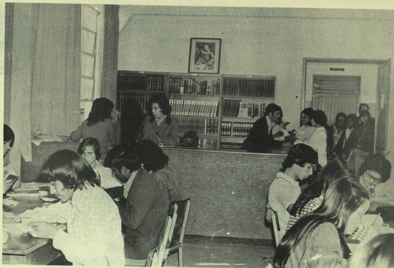
BIBLIOTECA.—Un total de 770 nuevos volúmenes fueron adquiridos para la Biblioteca donde se amplió el horario y mejoró el mobiliario.

También durante este periodo la Biblioteca renovó parte del mobiliario, se adquirieron 70 sillas nuevas, 2 mesas de trabajo y se dotó de alfombra al local, para reducir el ruido. Además se adquirió un sistema de clima artificial, que