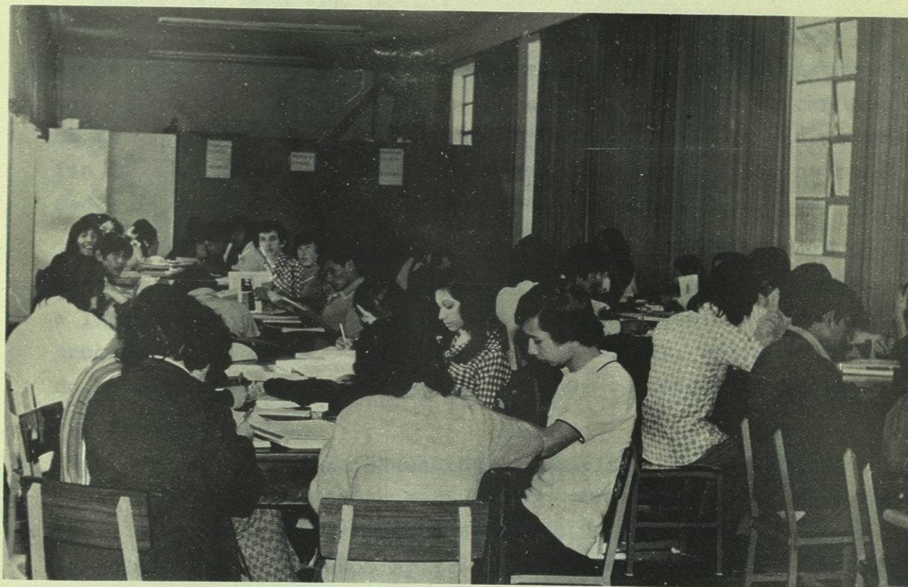
SE DUPLICARON LOS LECTORES.—Como se puede apreciar en la gráfica lo que hace necesario ampliar la sala de lectura, que ya fue conseguida ante el Gobierno del Estado.