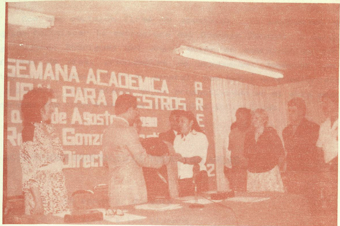
INAUGURACION DE LA III SEMANA ACADEMICA CULTURAL POR EL C. RECTOR GREGORIO FARIAS LONGORIA.