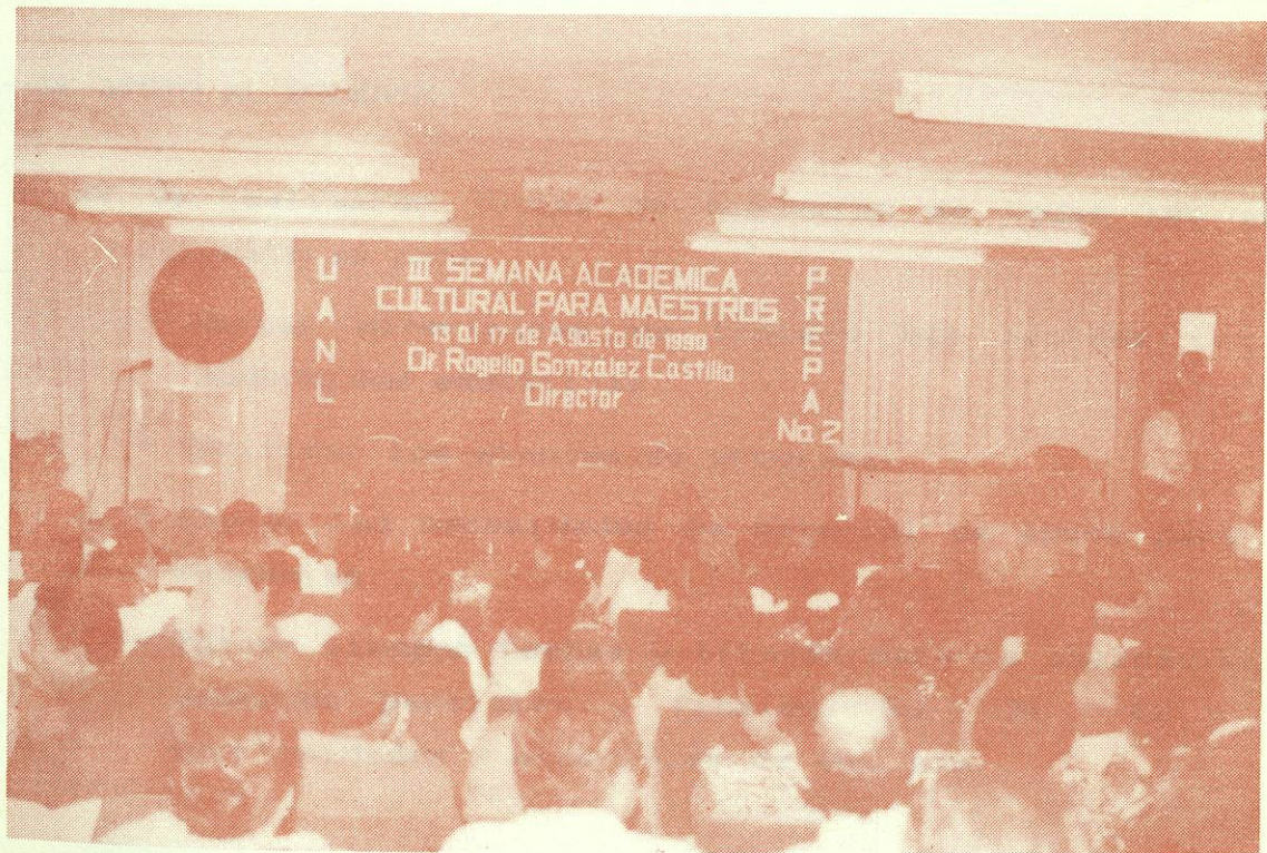
ASISTENCIA DE MAESTROS A LA INAUGURACION