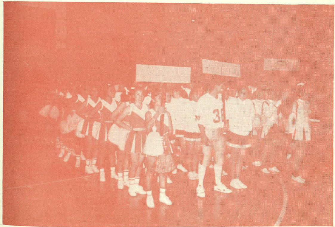
GRUPO DE PORRISTAS EN LA INAUGURACION DEL TORNEO INTRAUNIVERSITARIO.