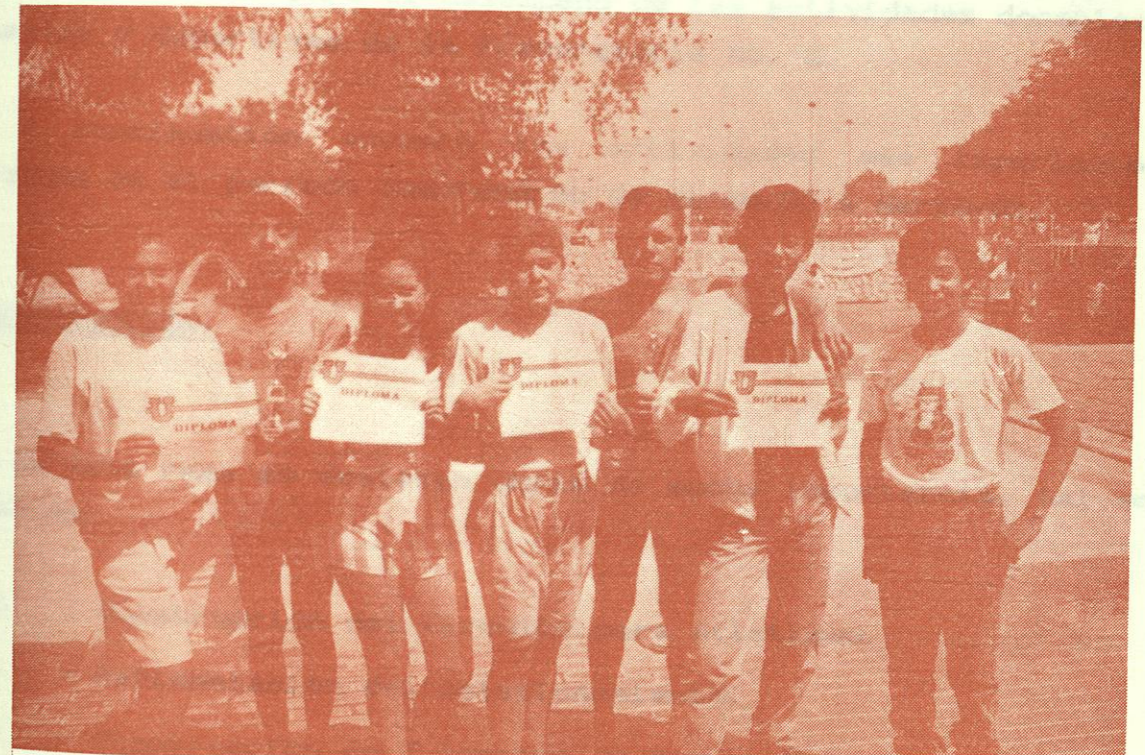
EQUIPO DE NATACION QUE PARTICIPO EN EL TORNEO INTRAUNIVERSITARIO.