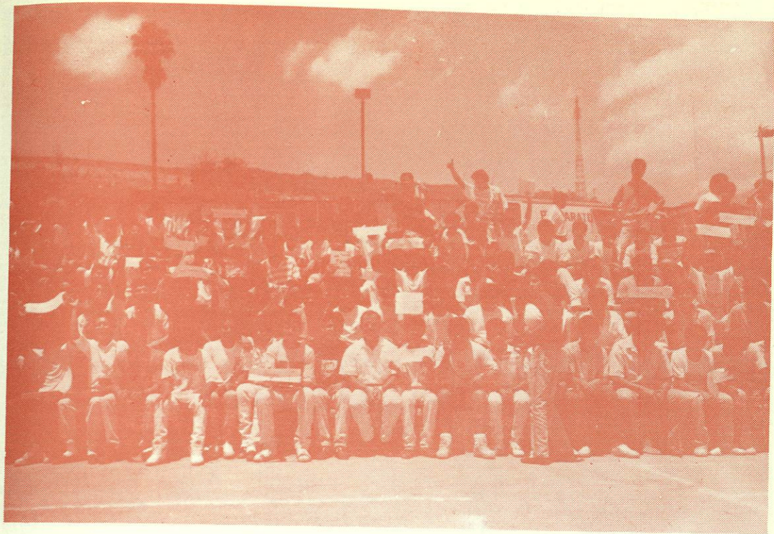
INAUGURACION DEL TORNEO INTERIOR DE FUTBOL

CAPITULO ALFONSO BIBLIOTECA UNIVERSITARIA U.A.N.H.