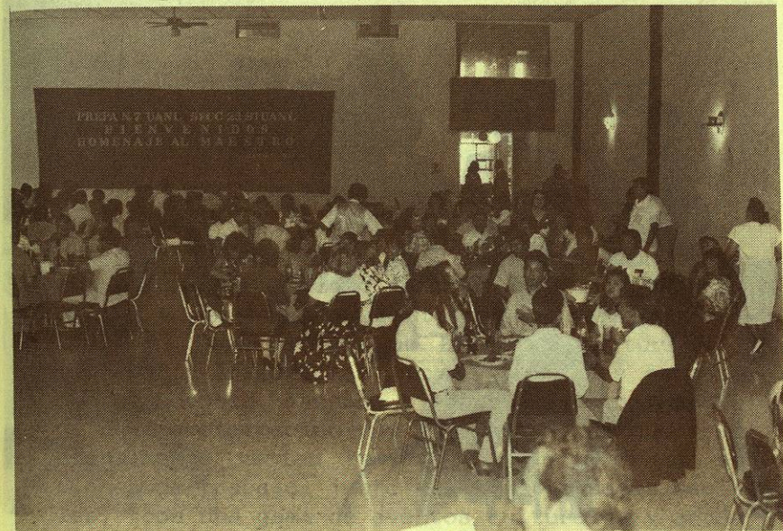
micos orientados a elevar el nivel formativo y de cultura general de sus compañeros estudiantes; estrechando cada vez más sus relaciones con la docencia, complementadas con conferencias motivadoras.