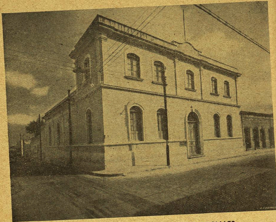
FACULTAD DE DERECHO Y CIENCIAS SOCIALES