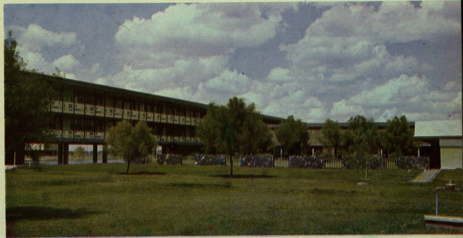
School of Business and Administration. Back view of the building.

La enseñanza práctica la adquieren los estudiantes en el Departamento de Investigación y en los Seminarios de Administración, Costos y Organización Industrial, Estudios Fiscales y Contabilidad y Auditoría.