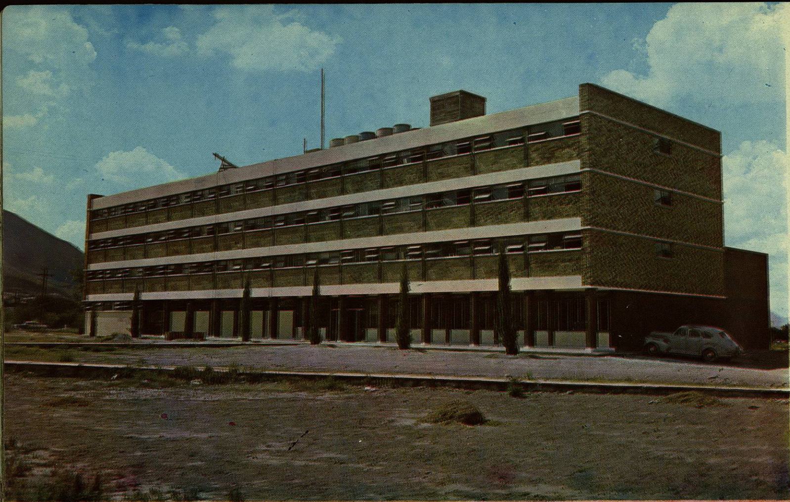
Escuela de Enfermería y Obstetricia.—Desde el primer año, sus alumnas forman parte del cuerpo de enfermeras del Hospital Universitario.

School of Nursing and Obstetrics.—The students of this school become members of the University Hospital's nursing staff from their first year of study and training.