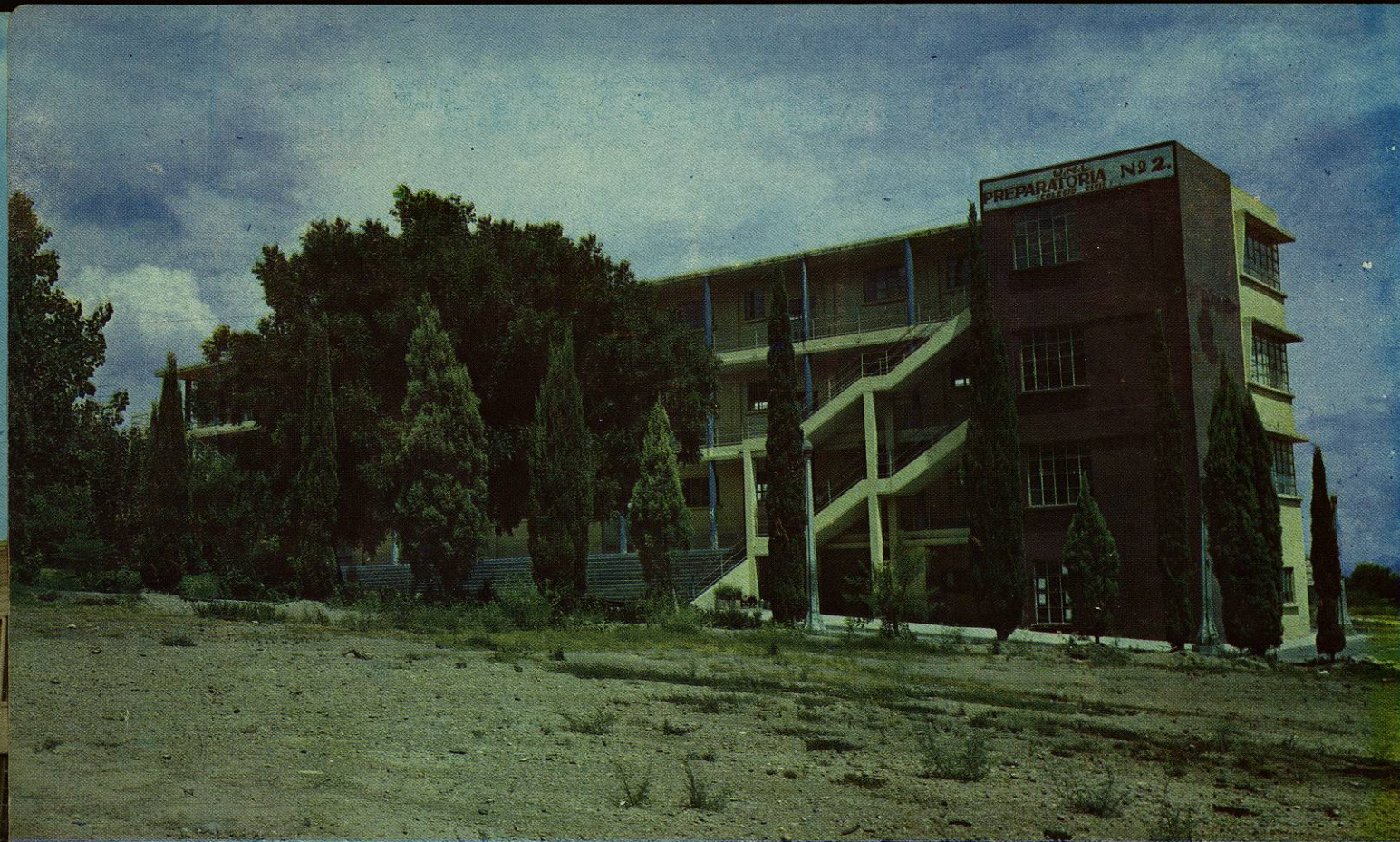
Escuela Preparatoria No. 2.— Dependencia del Colegio Civil del Estado, donde reciben instrucción mil alumnos que desean completar el ciclo de enseñanza media.

Preparatory School No. 2. This school is a branch of the State Civil School where one thousand students complete their intermediate education.