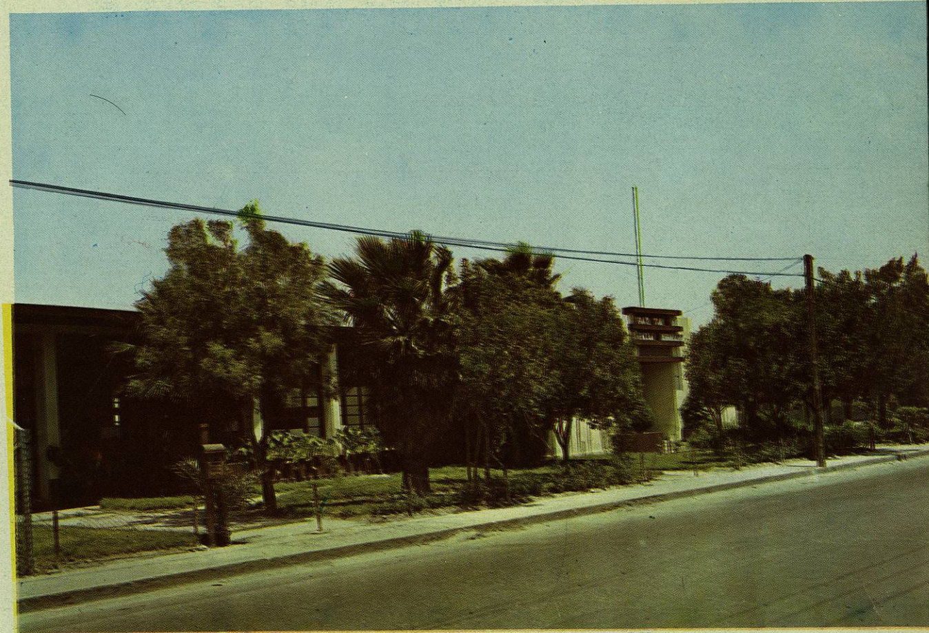
Facultad de Ciencias Químicas.—Imparte las carreras de Ingeniero Industrial, Químico Administrador, Ingeniero Químico, Químico Farmacobiólogo y Químico Industrial.

School of Nursing and Obstetrics.—The students of this school become members of the University Hospital's nursing staff from their first year of study and training.