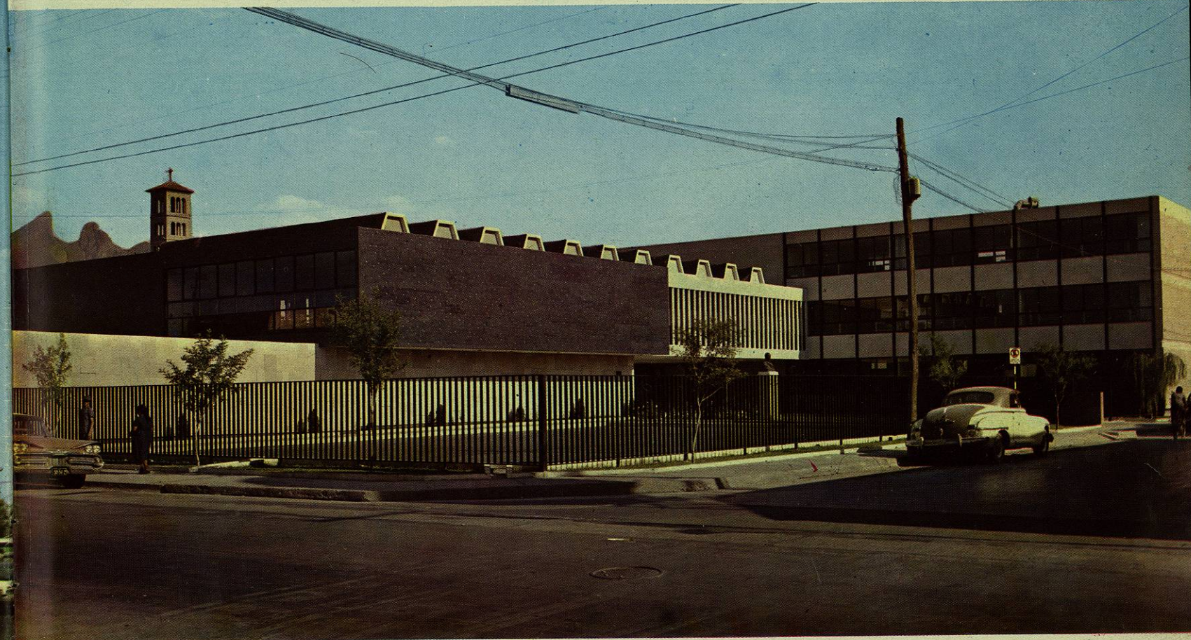
Escuela Industrial Femenil "Pablo Livas".—La mujer encuentra en este centro las enseñanzas necesarias para desempeñar oficios y actividades que la hacen más útil al hogar y a la sociedad.