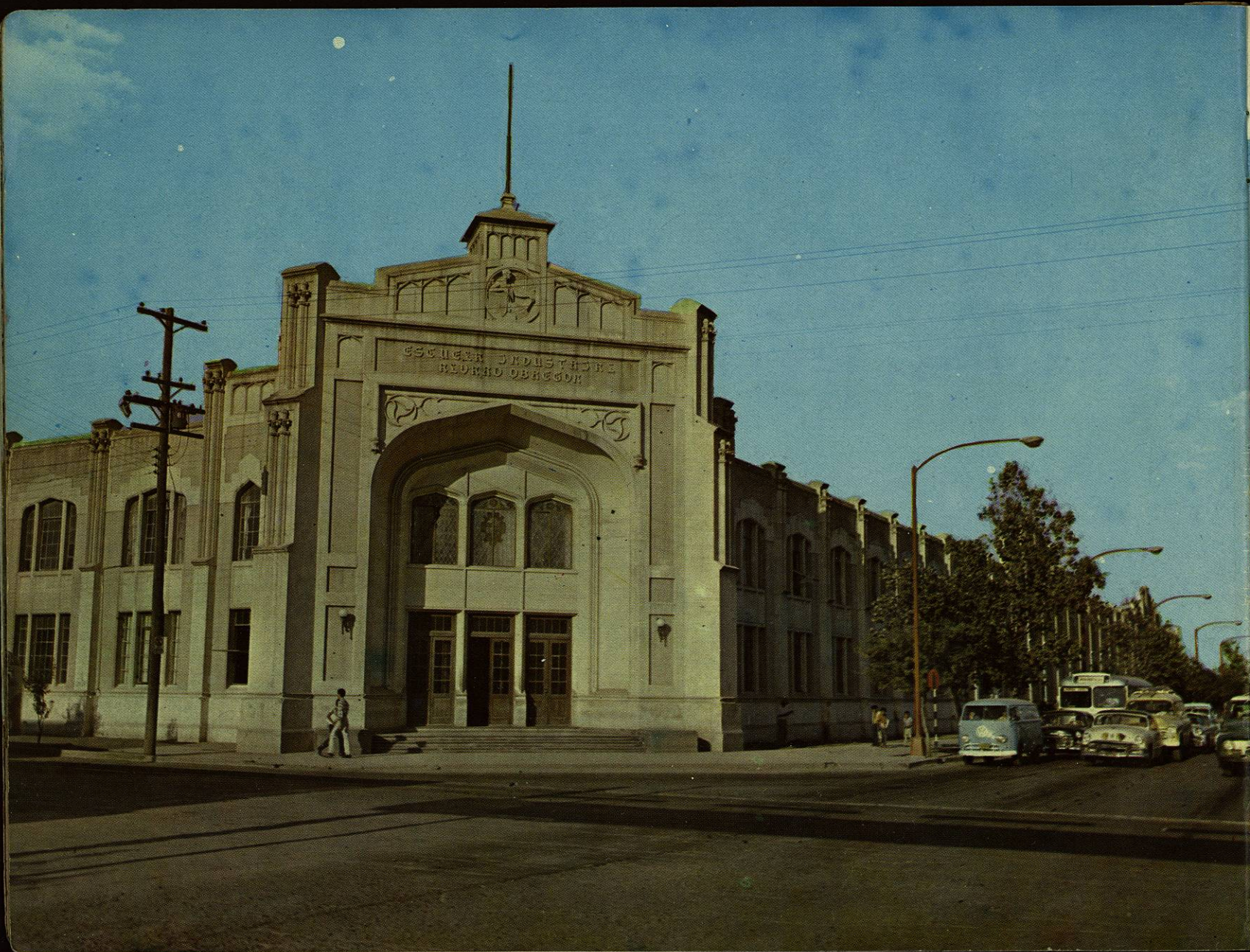
Escuela Industrial y Preparatoria Técnica "Alvaro Obregón".—De aquí egresan obreros capacitados para la industria nacional y aspirantes a seguir las carreras de Ingeniero Mecánico e Ingeniero Electricista.