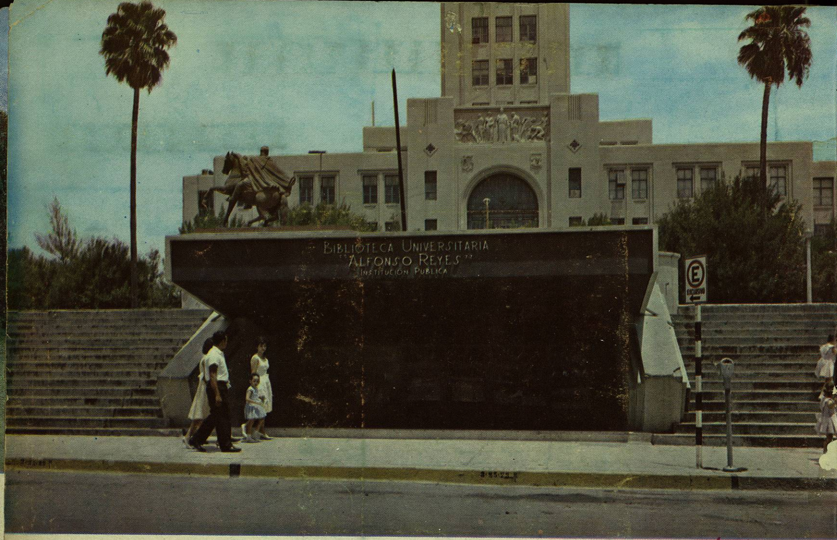
Biblioteca Universitaria "Alfonso Reyes". — Es la biblioteca central de la Universidad y el más importante centro de lectura de Monterrey.