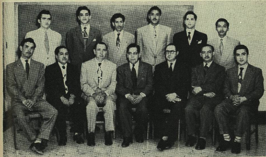
Grupo de Alumnos del Primer Año de Estudios Profesionales, en compañía del Director, del Secretario y algunos Profesores de la Escuela.