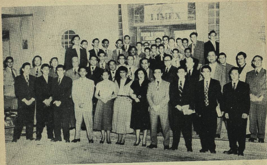
Grupo de Alumnos y Profesores al frente del local de la Facultad de Comercio y Administración. (Esquina Noroeste de 5 de Mayo y Juárez).