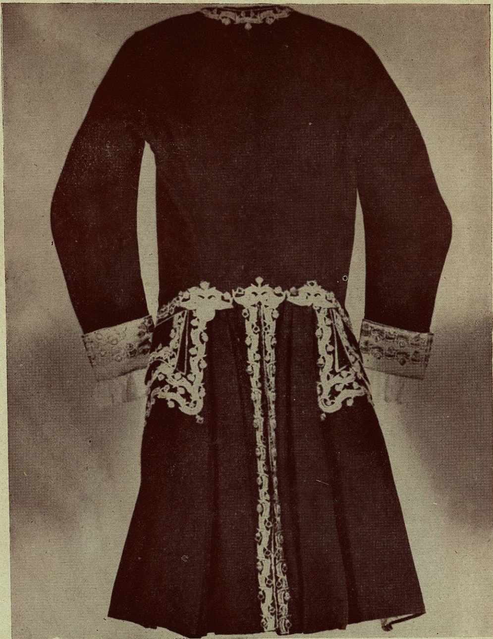
Casaca con bordados de hilo de oro, con botones de hilo de oro, puños de paño y forros de seda.