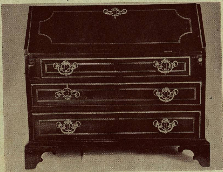
Escribanía de cedro con guarniciones de bronce dorado.