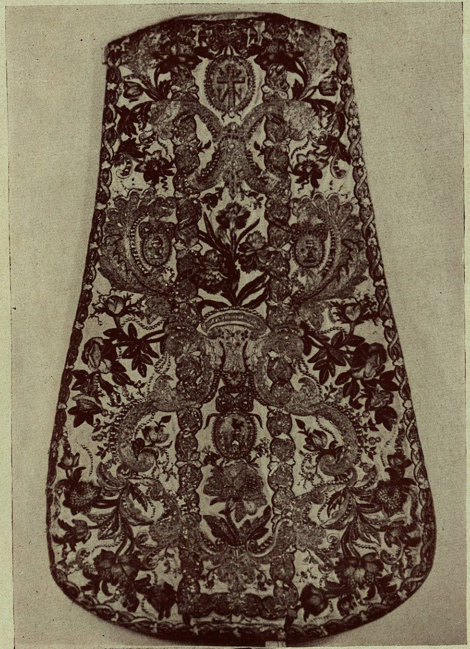
Casulla de seda con bordados de hilos de oro y plata y sedas de colores

UNIVERSIDAD DE NUEVO LEÓN BIBLIOTECA UNIVERSITARIA "ALFONSO REYES" Año 1925 MONTERREY, MEXICO