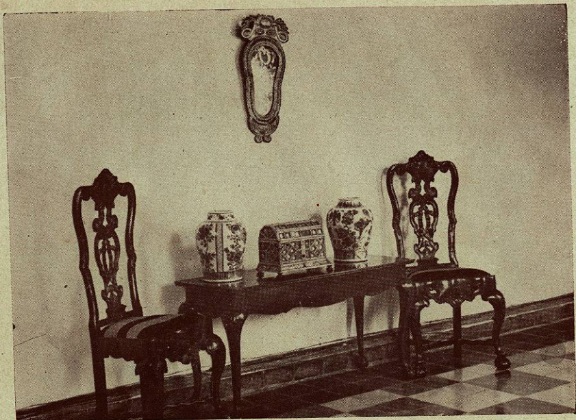
Arcón con aplicaciones de hueso y espejos, Tibores chinos de porcelana. Sillas y mesa, interpretación mexicana del Chipendale inglés. Espejo veneciano.