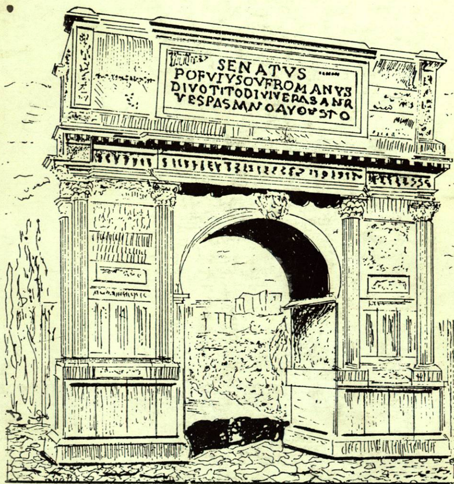
ARCUS TITI ARCO DE TITO