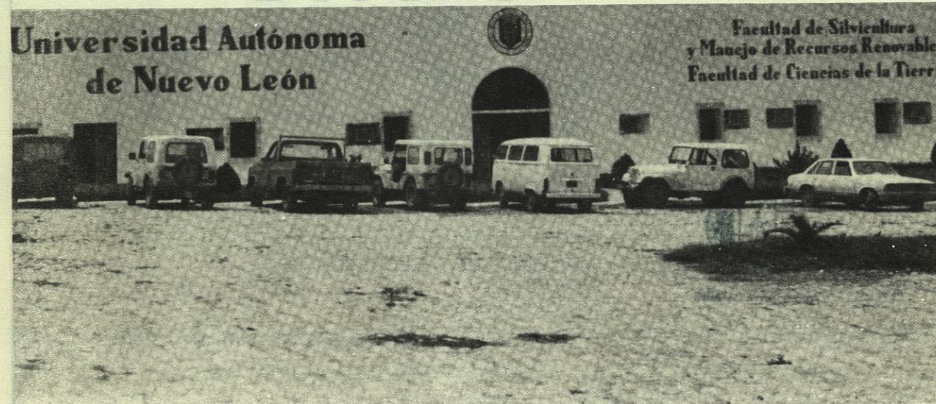
Edificio que alberga las facultades de Ciencias de la Tierra y de Silvicultura y Manejo de Recursos Renovables, ubicadas en la ex-hacienda de Guadalupe, en Linares, Nuevo León.