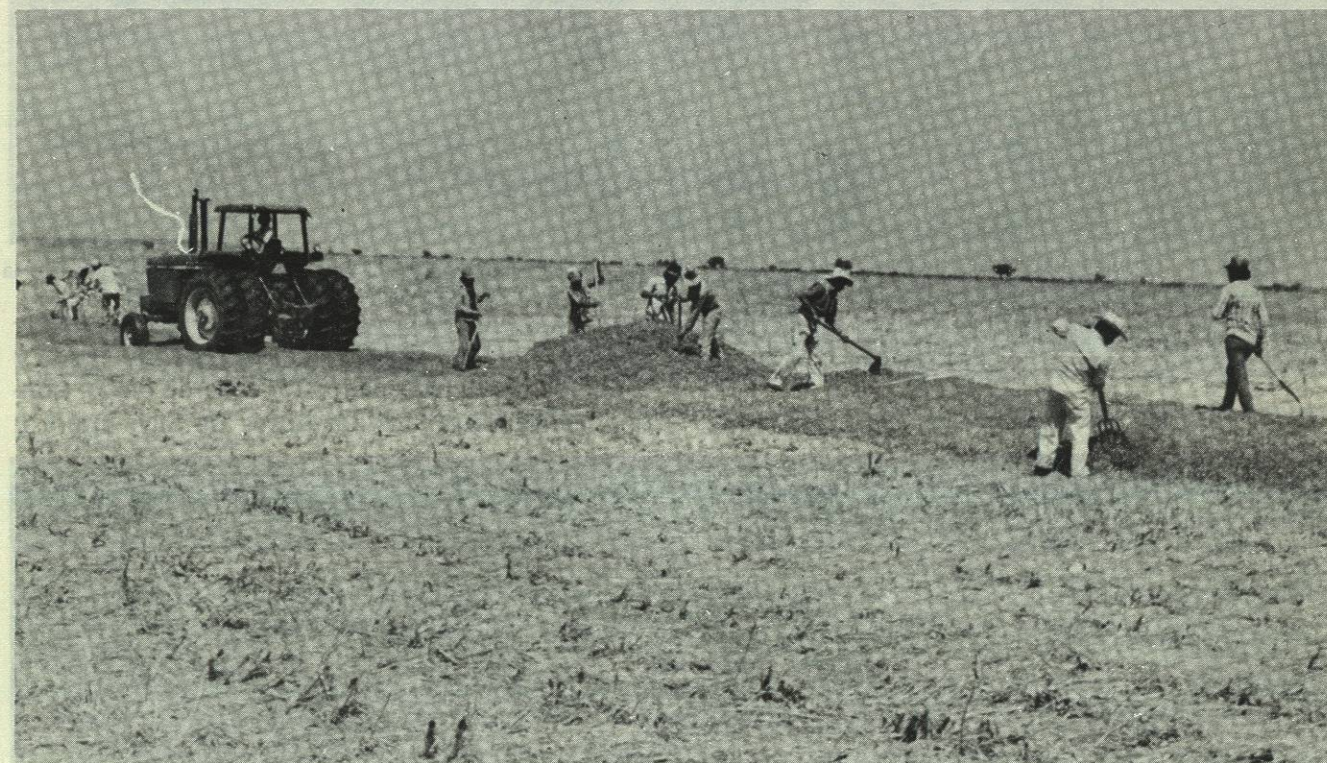
Empleados de la U.A.N.L. en el desempeño de Labores Agrícolas, dentro de los proyectos que se desarrollan en la Extensión de Linares.

Las actividades se iniciaron en una forma organizada, sistemática y programada, empezando