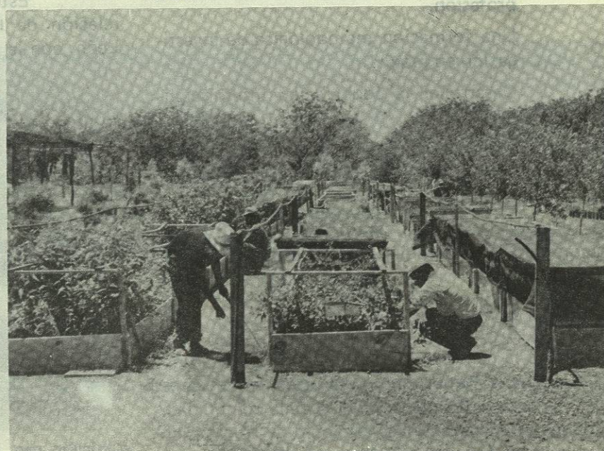
Viveros de las plantas más representativas de la región, ubicados en la ex-hacienda de Guadalupe.

El programa U.A.N.L. Extensión Linares, cuenta ya con dos realidades como lo son estas dos facultades, pero además, tiene como proyectos