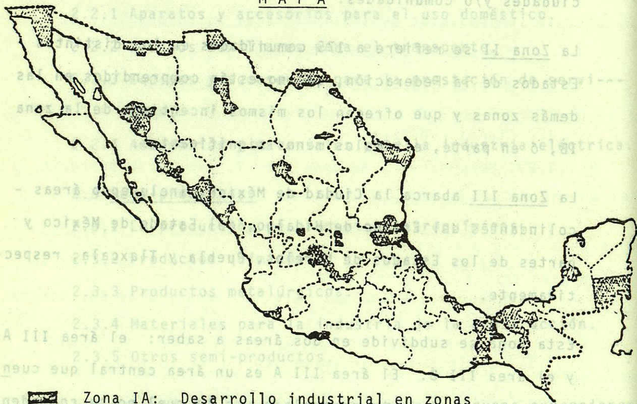
M A P A

El siguiente mapa de la zona de fomento I permite una vista general /9/: