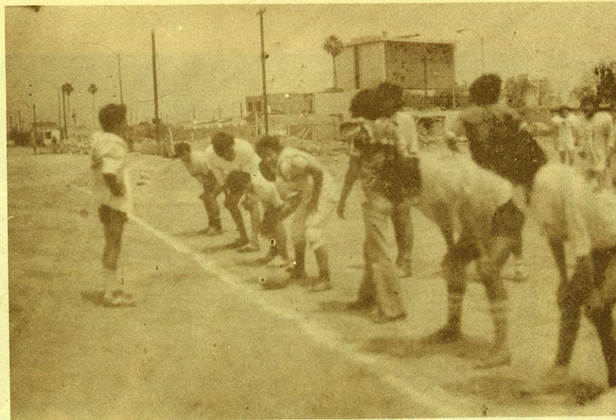
Entrenamientos del equipo de fútbol americano "SALAMANDRAS", que se alista a participar en su segunda temporada.