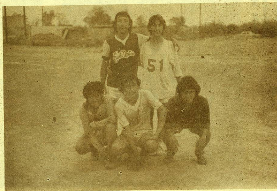
Backfield de las "SALAMANDRAS".