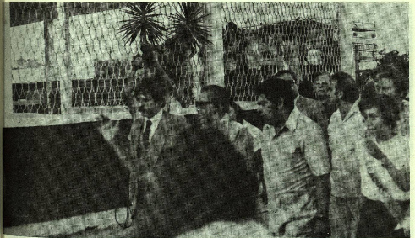
EL SR. GOBERNADOR DEL ESTADO DE NUEVO LEON., C. ALFONSO MARTINEZ DOMINGUEZ HACE UN RECORRIDO POR LAS INSTALACIONES DE LA PLAZA DR. JOSE ELEUTERIO GONZALEZ.