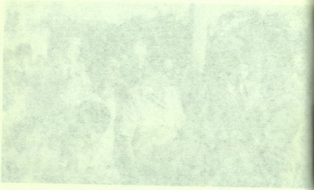
POSTERIORMENTE A LA INAUGURACION DEL AREA PEATONAL, CON AL FONDO Y SU COMITIVA SE DIRIGEN AL INTERIOR DE LA PREPARATORIA, CON EL FIN DE VER LA PLAZA CORRESPONDIENTE.