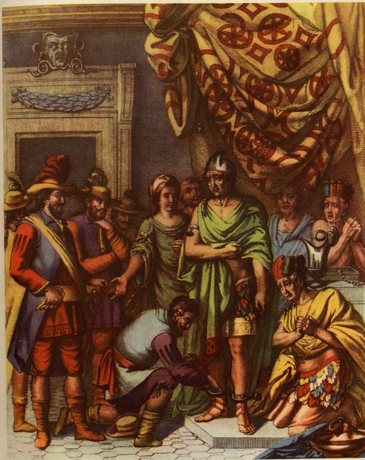
CORTES determina prender à Motezúma en su Palacio. Lle- vale a su Quartel donde le ponen grillos.