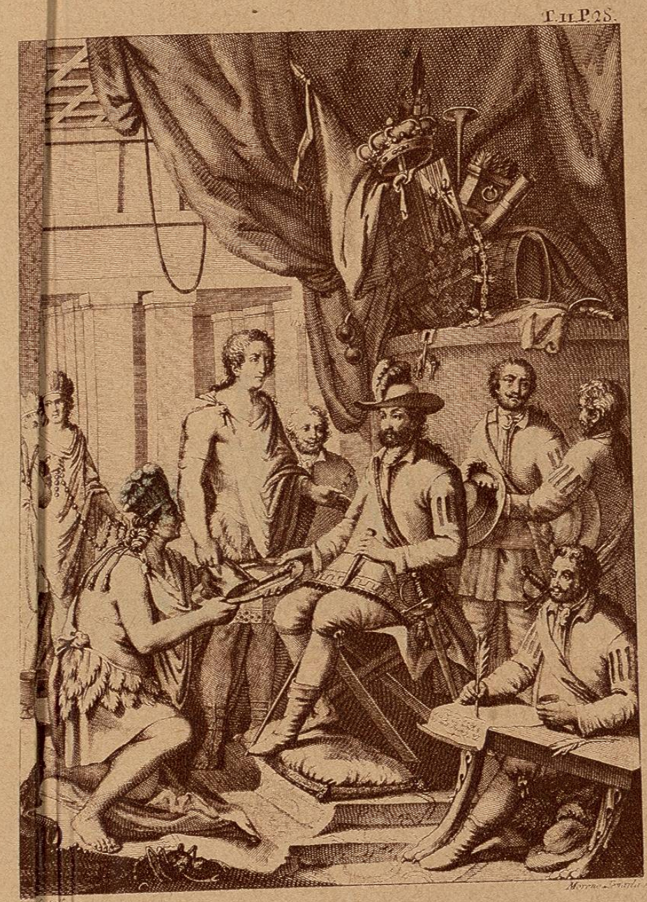
Ahuastotecatl, al Rey de España por sucesor de su Imperio: le da la obediencia, y tributo.