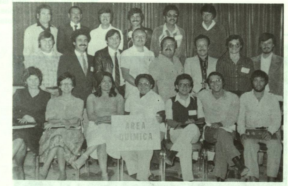
Reuniones de Academias que participaron en la Reforma Académica de 1972.