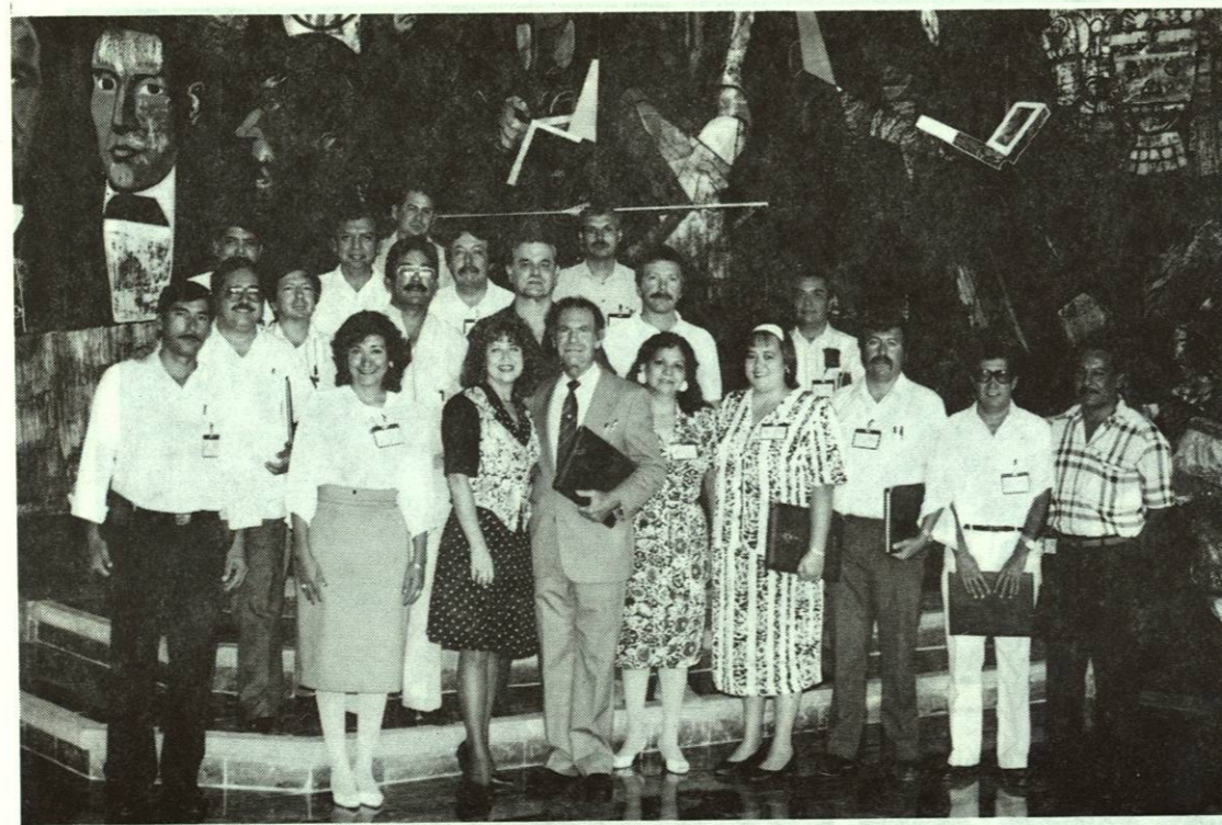
Nuestros docentes asistieron al Congreso de Matemáticas en el Teatro Universitario de la Unidad Mederos, del 2 al 5 de julio de 1991.