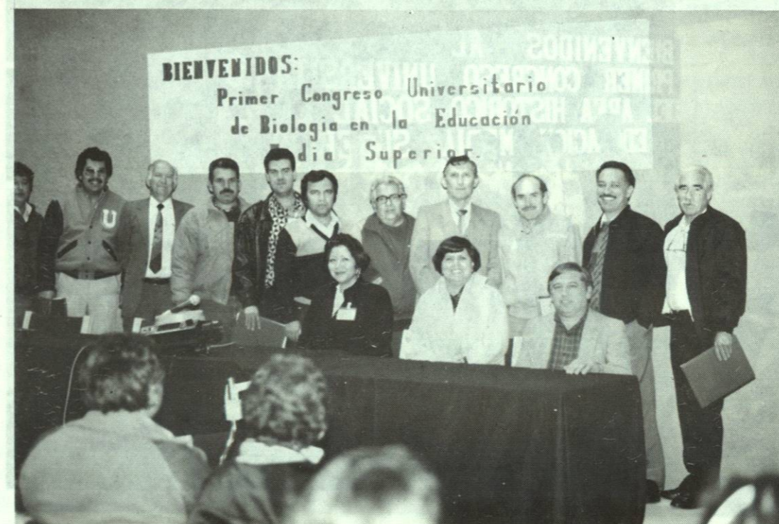
Los Profesores de la Academia de Biología, asistieron al Primer Congreso del Area, efectuado del 27 al 31 de enero de 1992, en la Unidad Mederos.