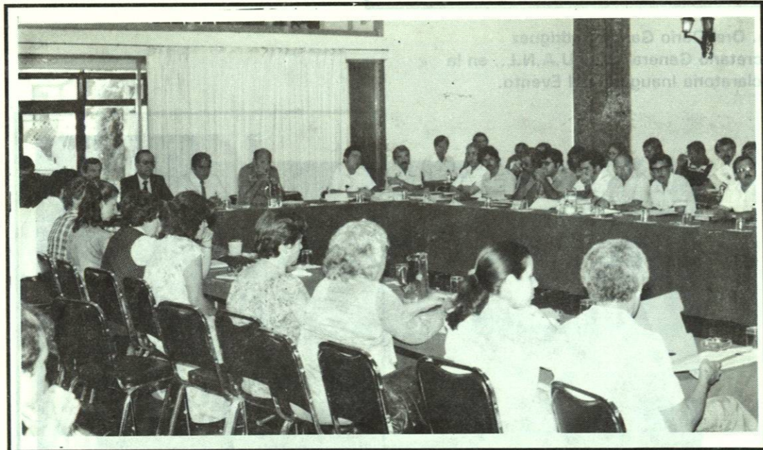
Panorámica de los asistentes a este evento académico.