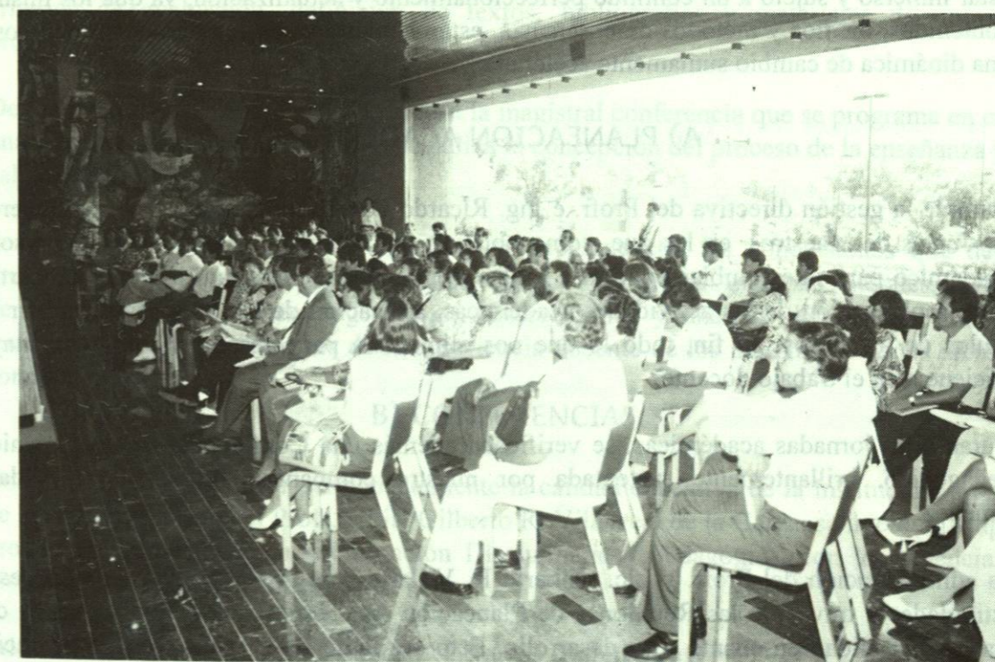
Asistentes al Congreso del Area de Lenguaje, realizado del 7 al 10 de julio de 1992, en el Teatro Universitario de la Unidad Mederos.