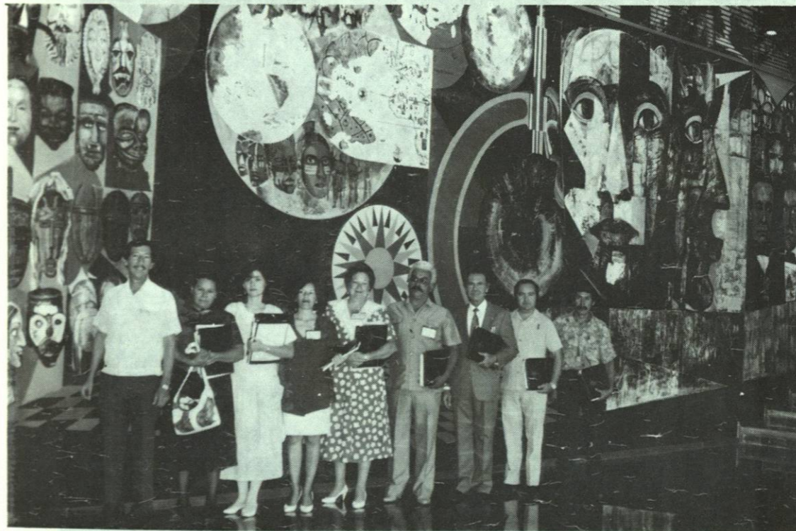
Teatro Universitario de la Unidad Mederos, sede del Congreso de Química del 24 al 27 de junio de 1991.