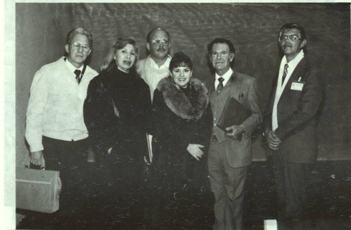
Maestros de la Academia de Inglés de la Preparatoria No. 7, que asistieron al Primer Congreso de Inglés, evento que se realizó del 14 al 17 de enero de 1992.