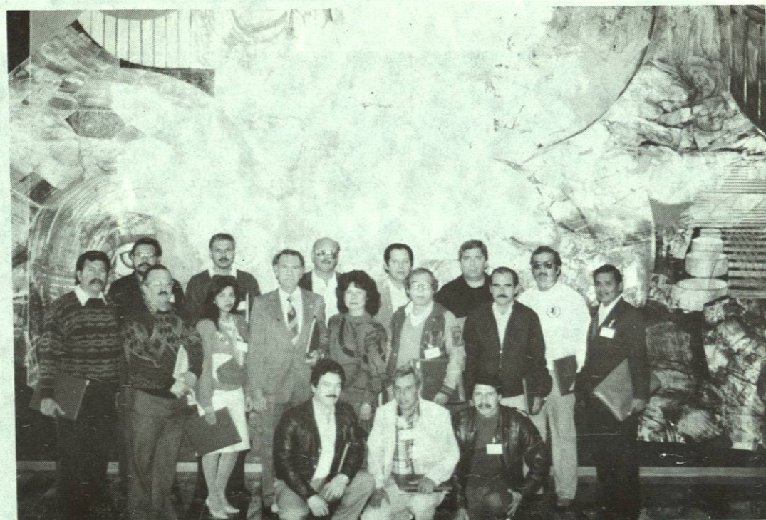
El Director acompaña a los Maestros que concurrieron al Congreso de Física, celebrado del 21 al 24 de enero de 1992, en el Teatro Universitario.