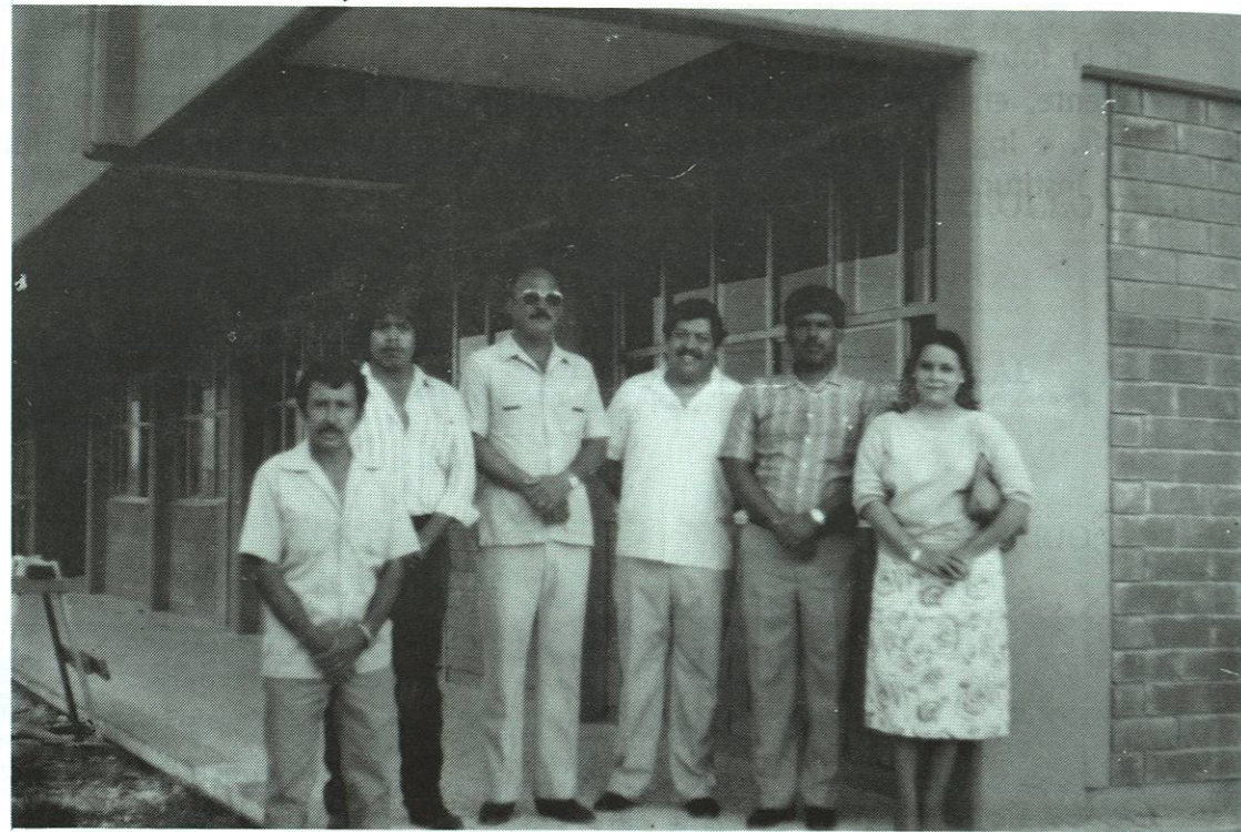
Parte del Personal y los 5 Grupos de Alumnos, fundadores de la Unidad Oriente