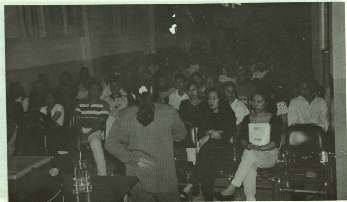
Alumnos de 4º semestre escuchando atentos una conferencia de Orientación.