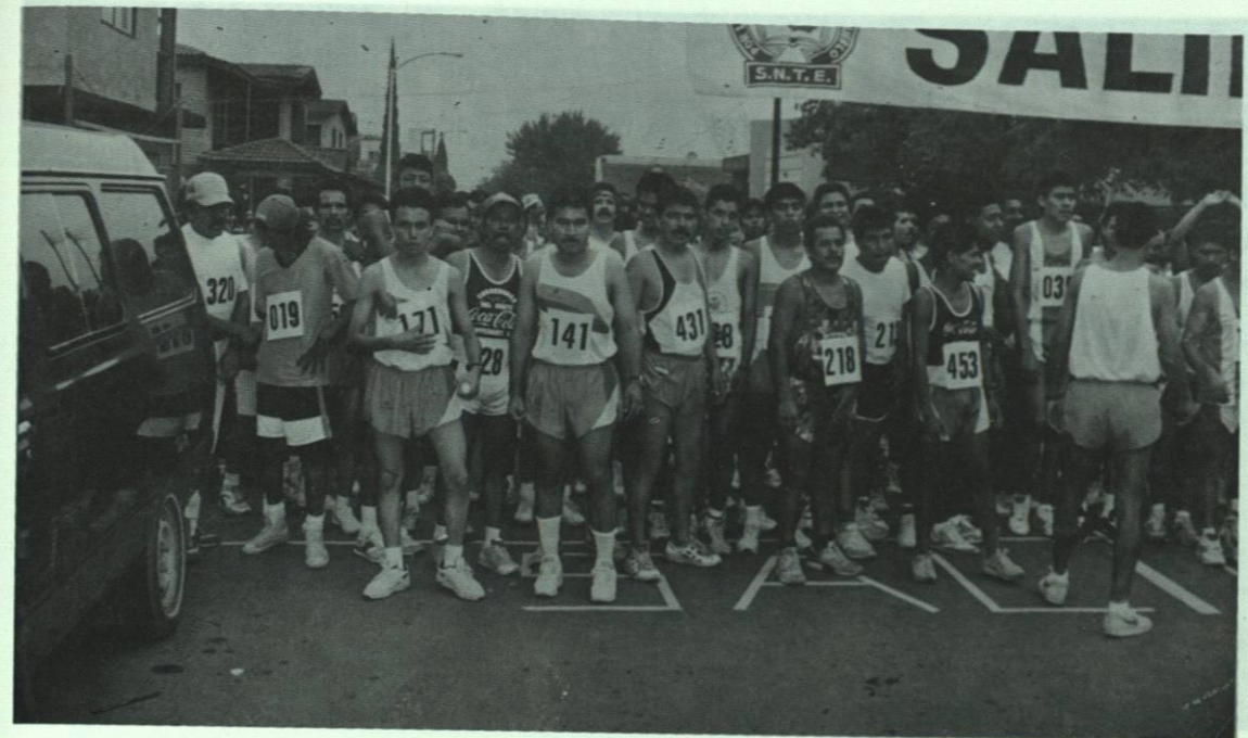
Nuestro equipo atlético, disponiéndose a competir.