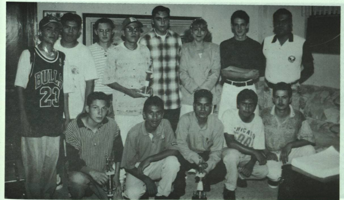
Entre El equipo de Baskethbol, posando con los trofeos adquiridos. de esta preparatoria.