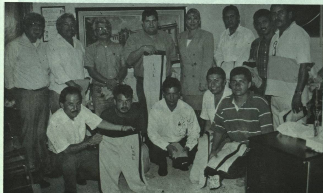
Entrega de uniformes deportivos a maestros y empleados de esta preparatoria.