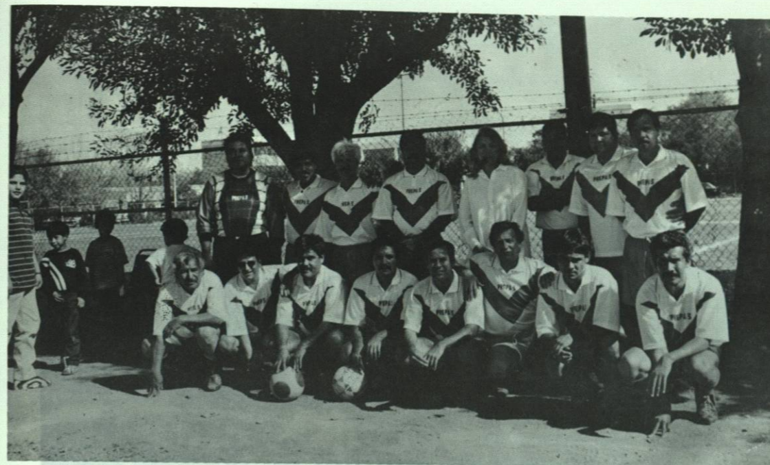
Maestros y empleados también compiten en torneos deportivos.