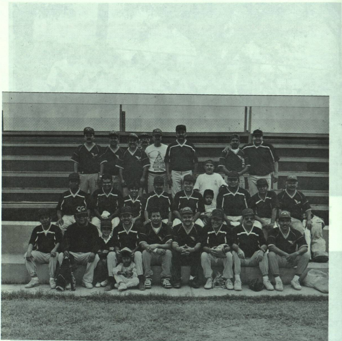
Los dos equipos representativos de nuestra escuela, en amistosa convivencia.

Entrega de uniformes deportivos a miembros y empleados de esta preparatoria.