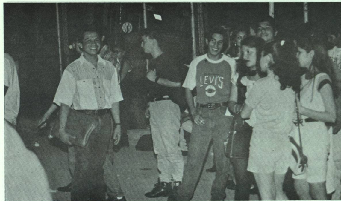
Convivencia estudiantil sana durante un festejo.