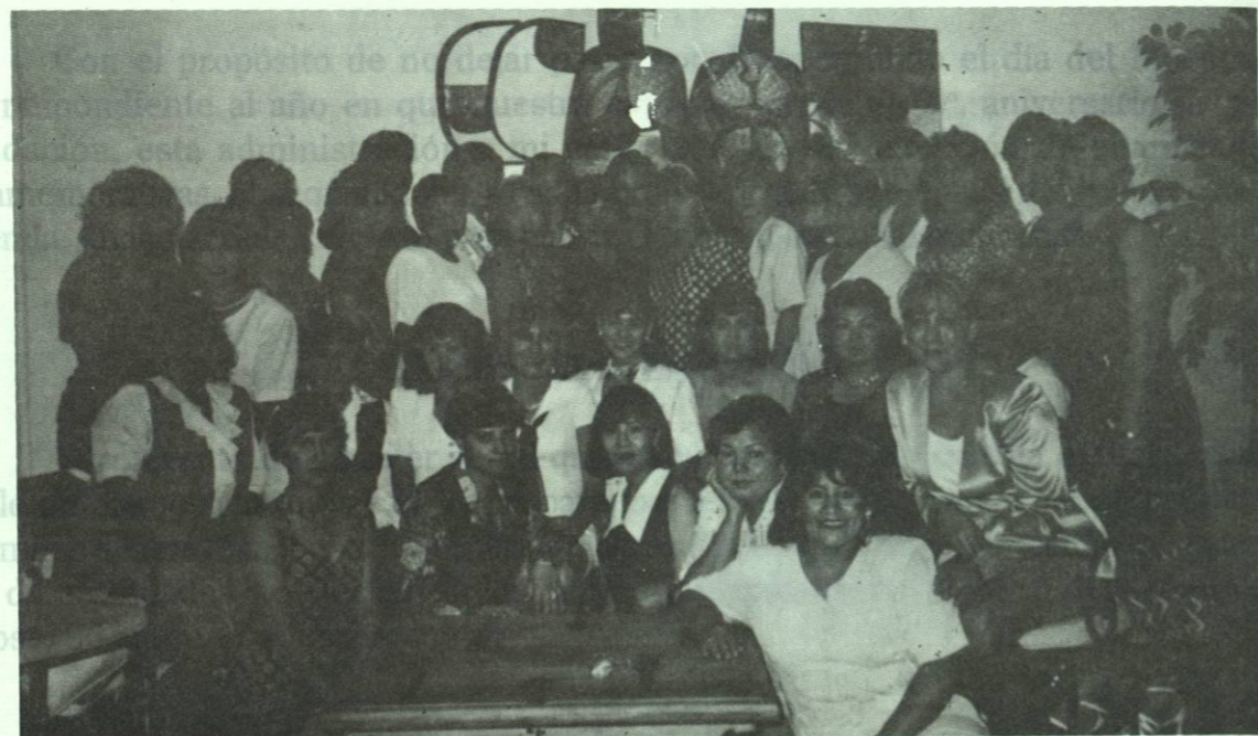
Nuestras secretarias, felices festejando su día.