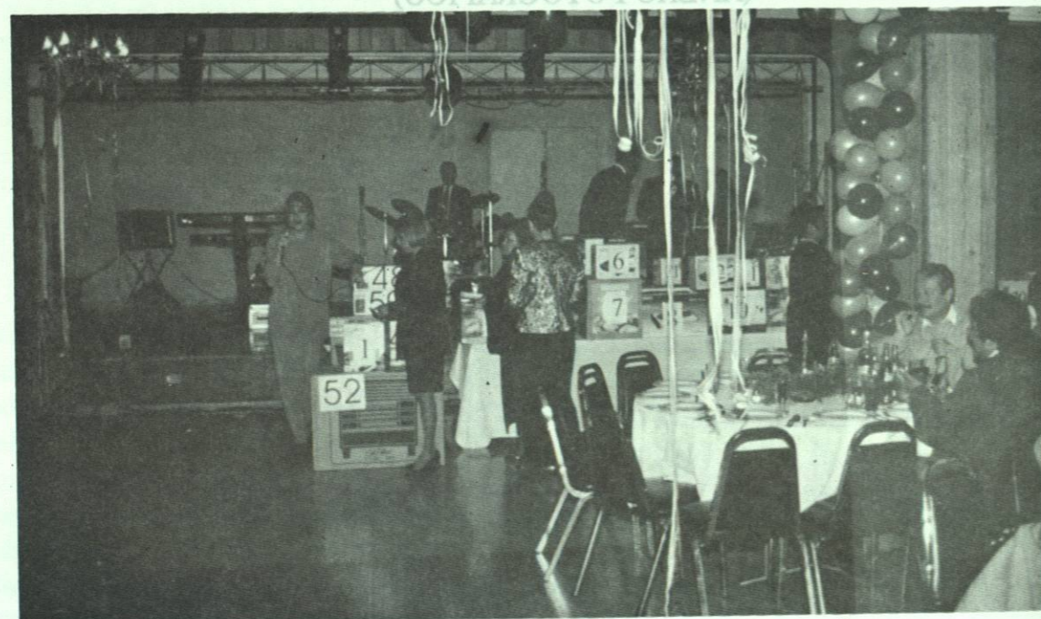
Deseando salud y prosperidad a nuestro personal en la posada navideña.