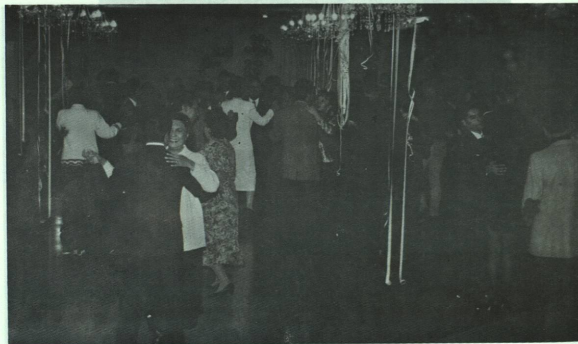
Otro aspecto de la Posada Navideña 1996.