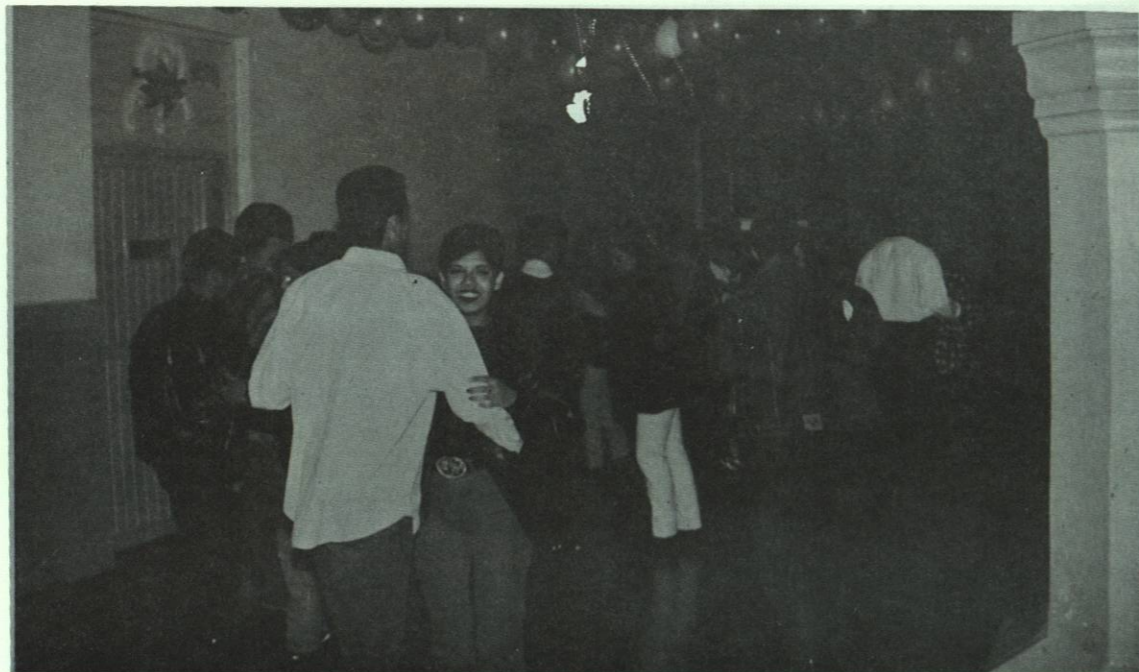
Baile estudiantil por el día de la Amistad.