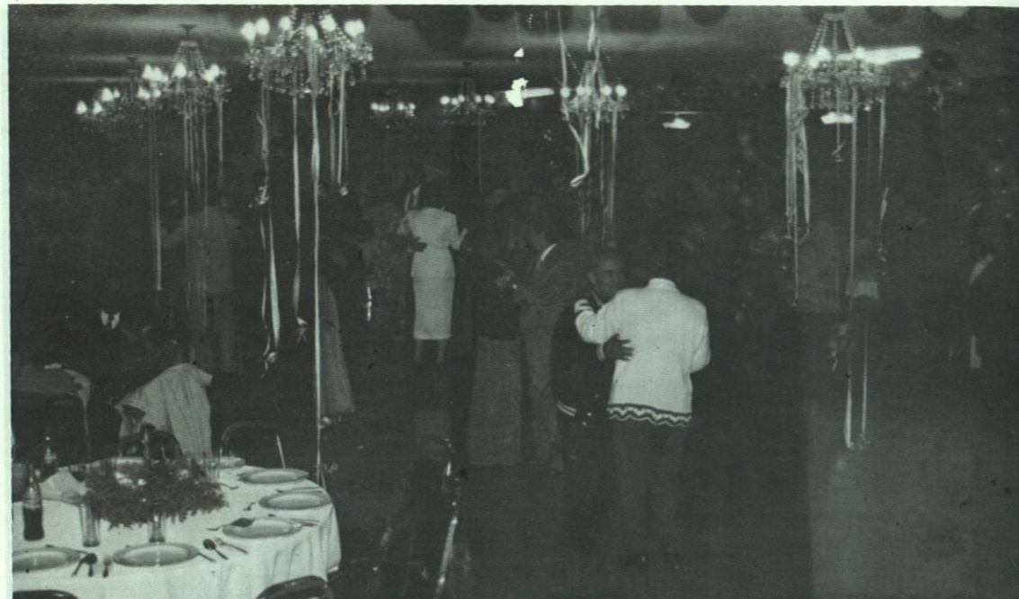
Nuestro personal disfrutando de la Posada Navideña 1996.