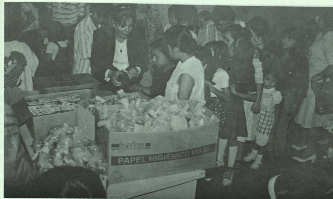
Reparto de obsequios a los hijos de maestros y empleados de nuestra preparatoria.