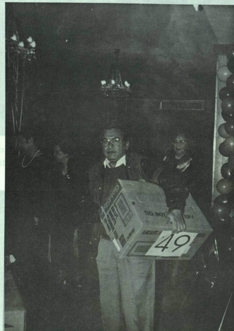
Un afortunado compañero recoge su premio en la posada navideña 1996.