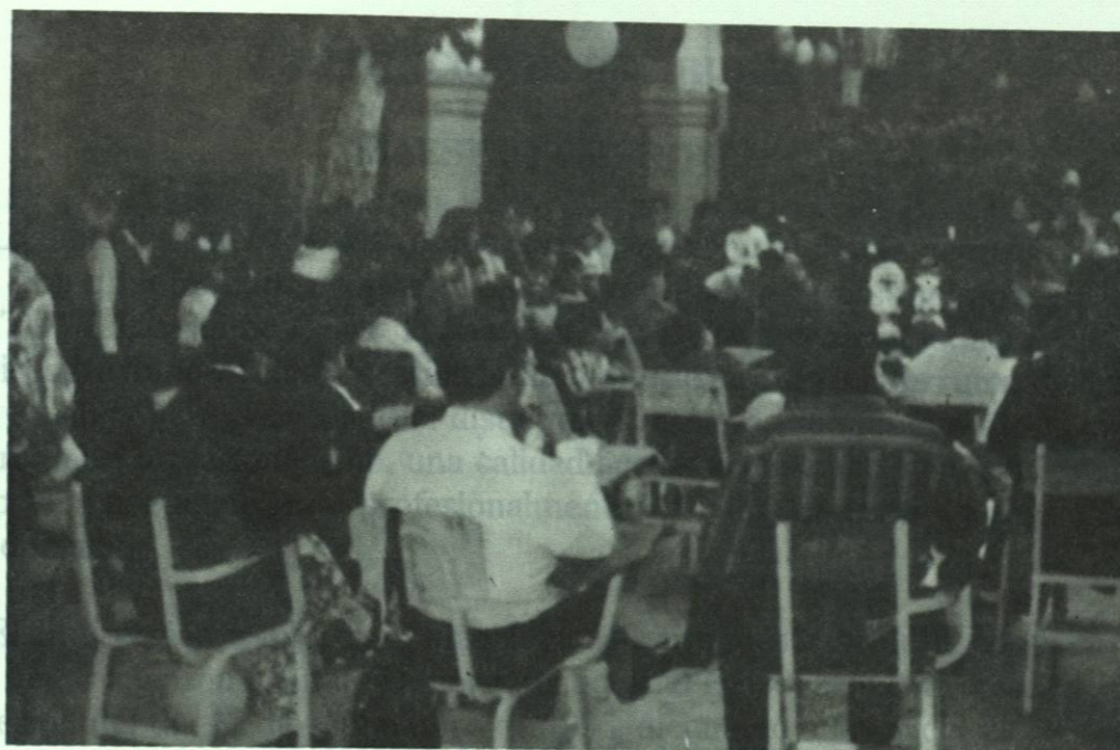
Dos aspectos de la Posada Navideña, para los hijos de nuestros trabajadores.