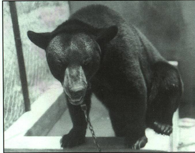
La Facultad ha contado a largo de su historia con varios osos que han sido su mascota.