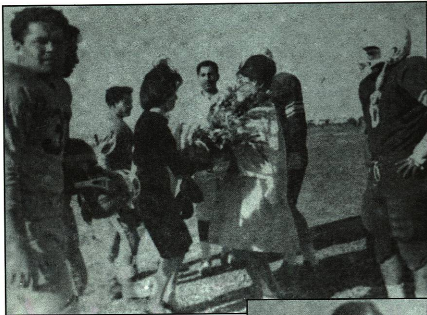
Las madrinas de los equipos "Castores" de Ingeniería Civil y los "Osos" de Ingeniería Mecánica, intercambian ramos de flores durante la inauguración del torneo de fútbol americano en 1963.