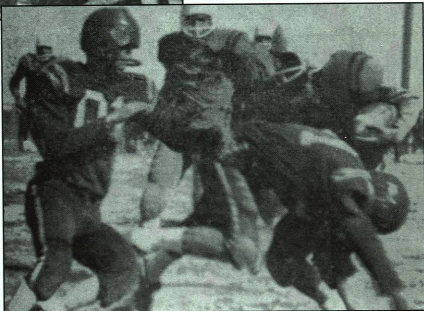
Una acción del juego inaugural en febrero de 1963