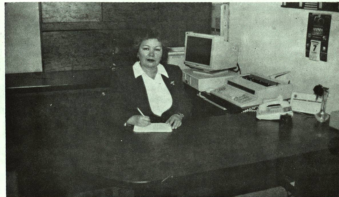
Moderno y funcional equipo de oficina para una adecuada atención a maestros y alumnos.