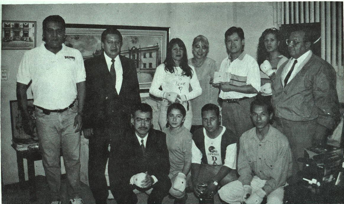
Nuestro equipo de Karate sigue recibiendo todo el apoyo. Entrega de implementos para la práctica de este deporte.