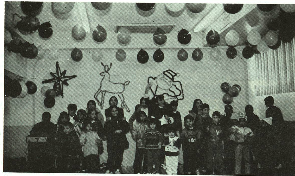
Aspecto de la posada navideña para los hijos de nuestros compañeros trabajadores.