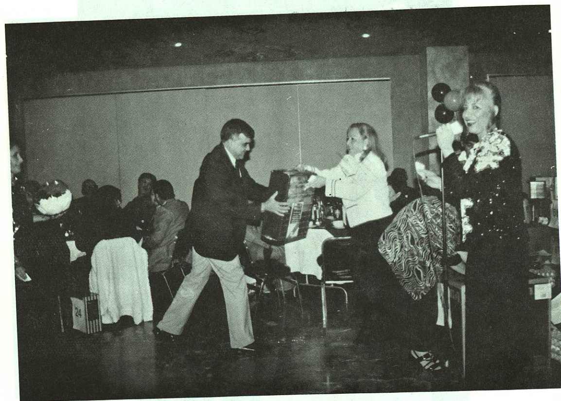
En la Posada Navideña 1997, no podían faltar los regalos, que se rifaron entre todos los trabajadores.