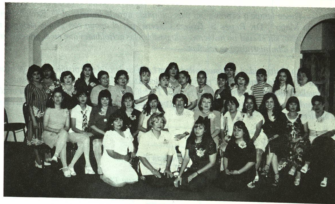
Nuestras compañeras secretarias disfrutando de una amena reunión en honor de su día.