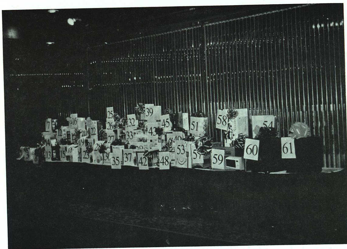
Como sencillo reconocimiento a su gran esfuerzo, los regalos no podían faltar en la fiesta del Día del Maestro.

de la fundación de nuestra preparatoria, esta administración a mi cargo unió la conexión de chamarras deportivas conmemorativas de día de aniversario, con el logotipo que identificó cada una de las actividades de carácter académico, cultural o deportivo con que esta comunidad escolar tuvo tan grata memoria. Con el propósito de recibir en todo lo que vale el esfuerzo de nuestros maestros, esta administración a mi cargo obsequió el 20% del costo de la prenda, financiándose el resto para cubrir en su quincena. Las chamarras se obsequiaron en varias etapas para satisfacer el gusto particular de los maestros.