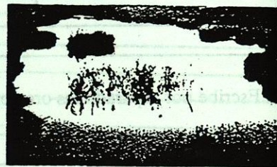
Carlos Rangel P. "Las fuentes del río fuerte" Rev. México desconocido, noviembre de 1991.

"Azul color de noche. Como chispas de fuego, como una fogata gigantesca que ardiera sobre la tierra, un amarillo casi blanco aparece rodeado de toda la gama de rojos hasta desaparecer en lo más oscuro del azul: Son las 8:30 de la noche y está atardeciendo. El cielo destila colorés".