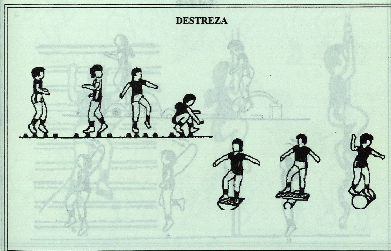
Figura No. 1.1

Recordando que las capacidades físicas coordinativas son agilidad, equilibrio y destreza donde principalmente el sistema nervioso determina el funcionamiento o desarrollo de las mismas; se presentan a continuación algunos ejercicios para el desarrollo de estas capacidades. (Antes de iniciar la actividad se recomienda realizar los ejercicios de calentamiento muscular general).