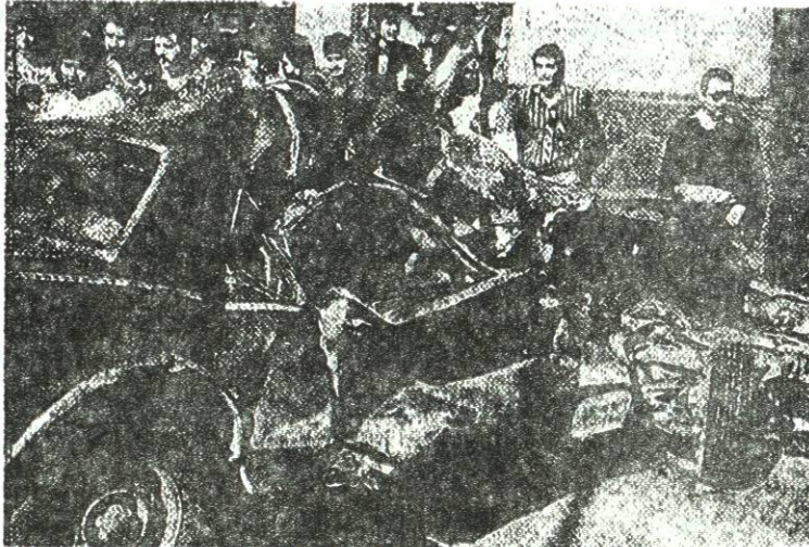
La mujer quedó prensada en el vehículo y cuando fue rescatada ya estaba muerta.

Camión de pasajeros choca el vehículo en el que viajaba la señora