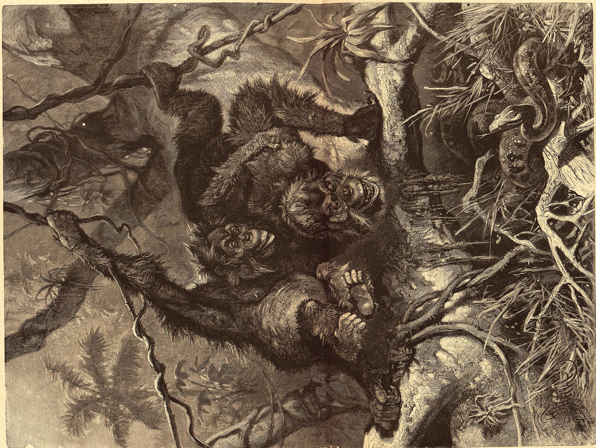
ORANGUTANES, POR SPECHT