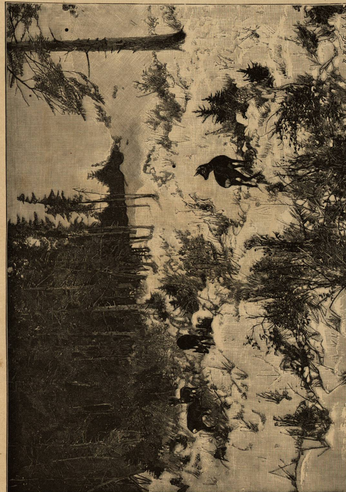
Entre riscos y floresas, por Bong

«Está por despuntar un hermoso día del mes de setiembre.