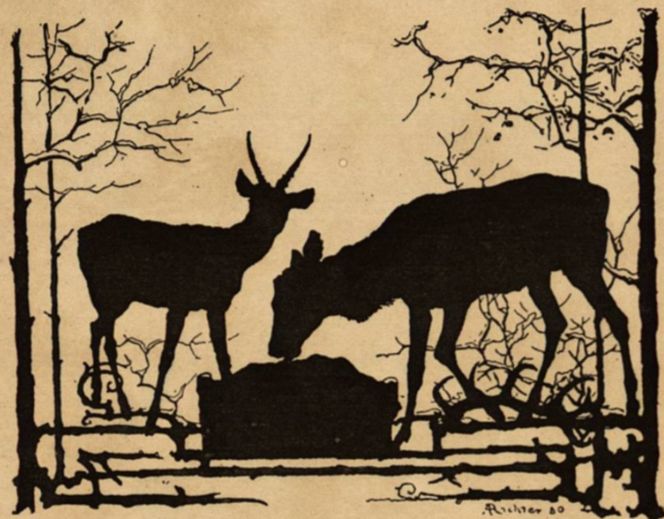
Los ciervos en enero

Algunos agrónomos, predicando en nombre de los