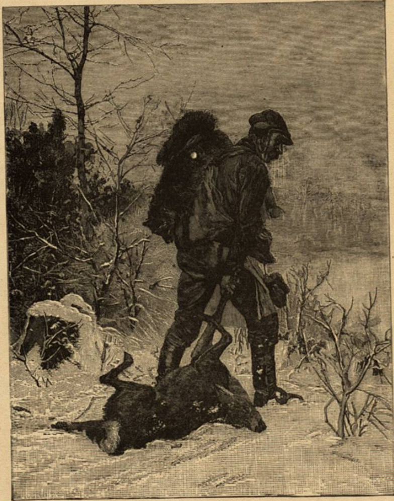
Un cazador furtivo

15. La huella limpia. —Cuando los venados pasan por terrenos areniscos, estando éstos húmedos, marcan la huella perfecta, y se le da el nombre de huella limpia ; la de la hembra está más borrosa, porque no va tan cerrada.