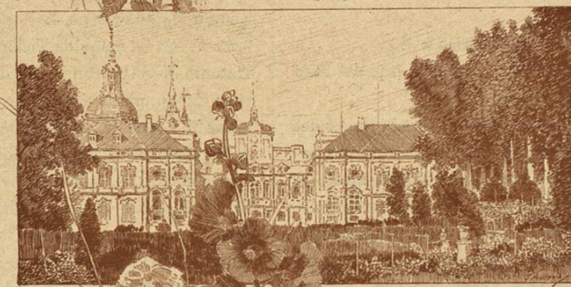
Palacio real de San Ildefonso

1.—El invictísimo Carlos Quinto, Emperador de Alemania y Rey de España (T).