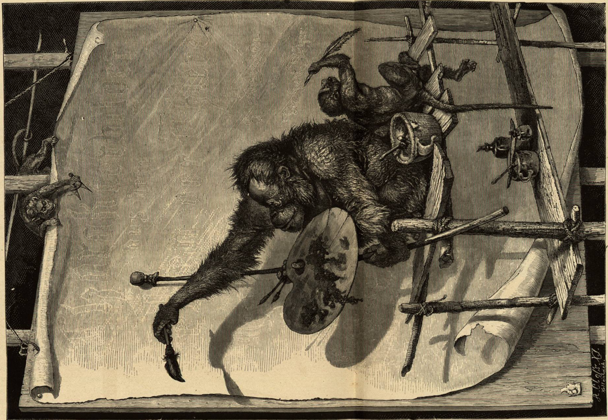
UN PRIMOROSO ARTISTA