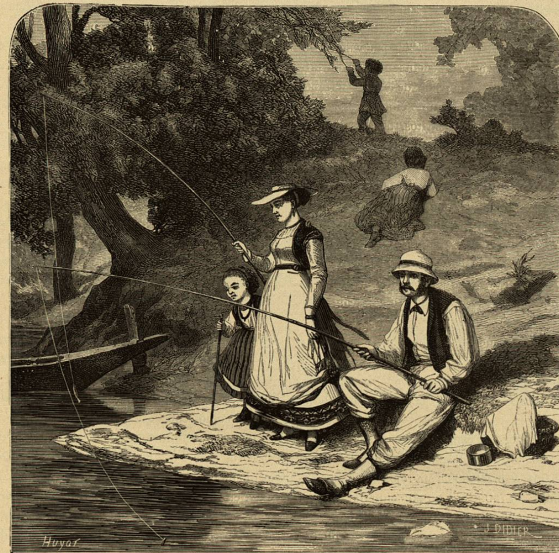
Pesca con caña

En 1885 se cogieron 28,427 quintales de mero, cuyo valor fué de libras esterlinas 20,053 y estas cifras representan un aumento de 5,377 quintales en cantidad y libras esterlinas 2,429 en valor, con relación al año