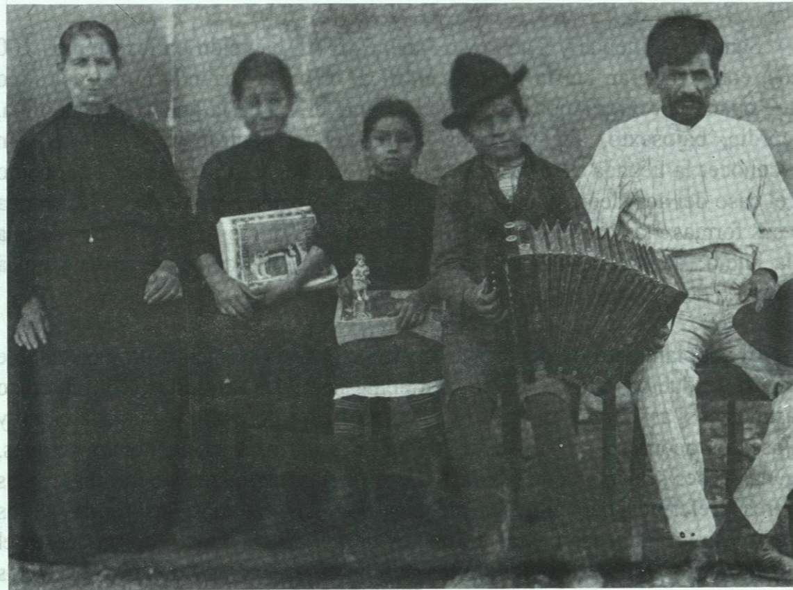
Instrumento: Acordeón rudimentario de una sola hilera de botones. Familia no identificada de Santiago, N.L. en 1886.