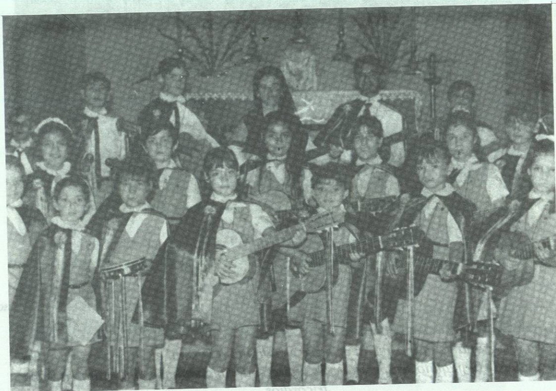
Estudiantina del Colegio Renacimiento