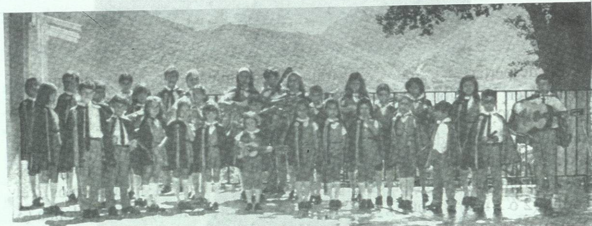
Estudiantina del Colegio Renacimiento