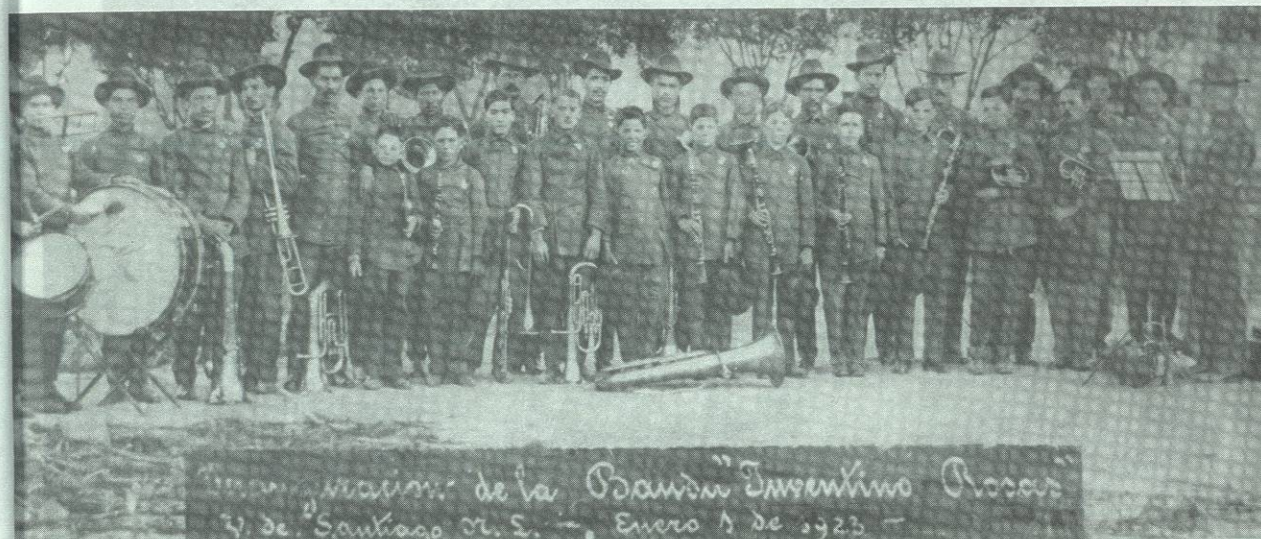
La Banda Juventino Rosas de la Villa de Santiago el día de su inauguración el 1 de enero de 1923.