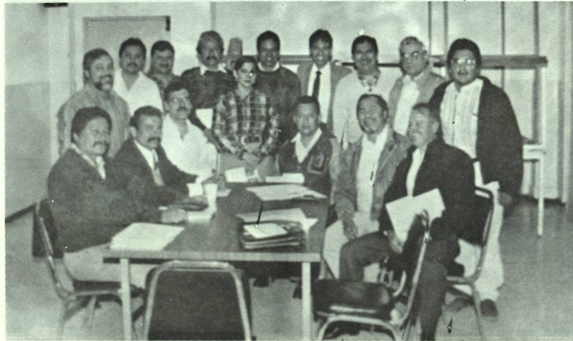
La Academia de Matemáticas al inicio del semestre.