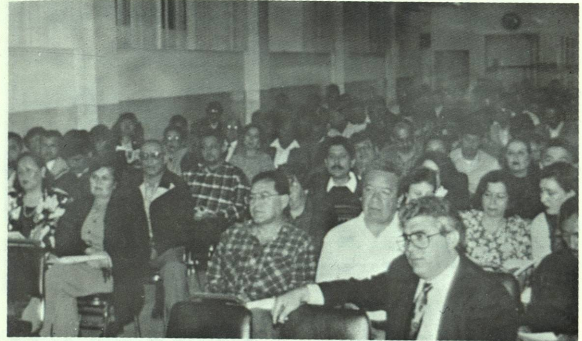
Aspecto de la Junta de Maestros, al inicio del semestre.