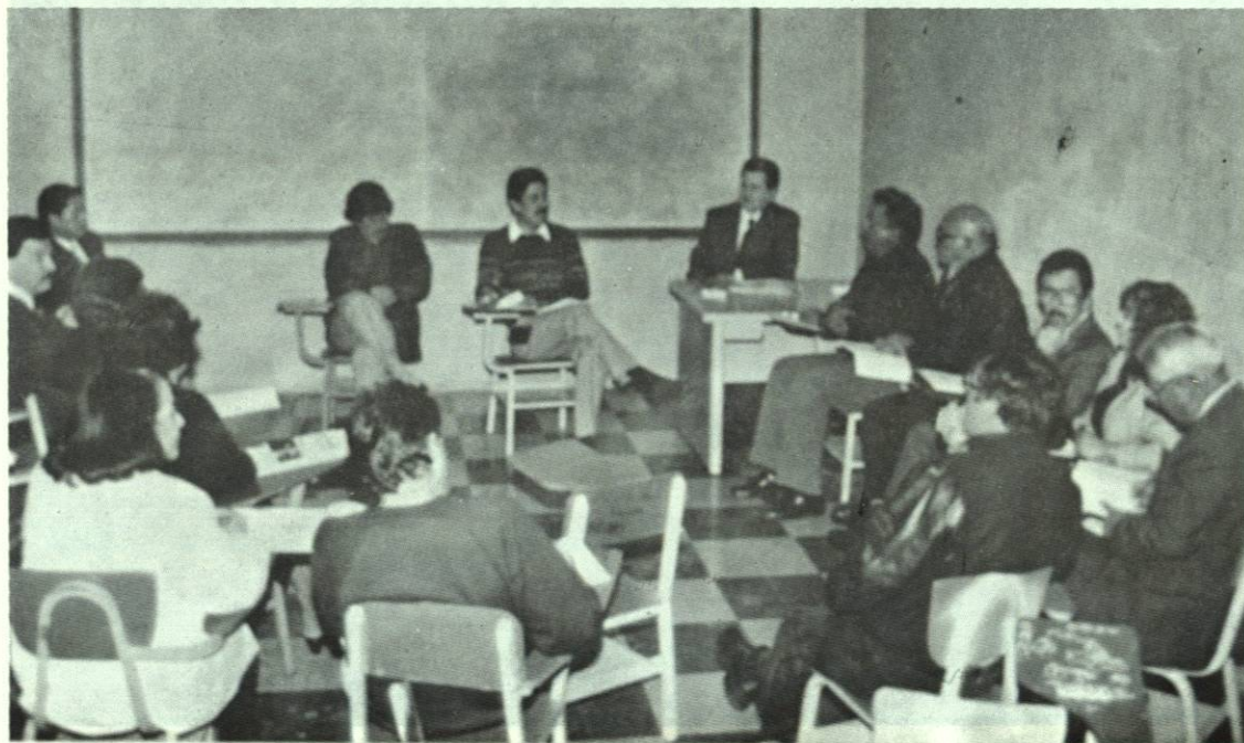
Reunión de Trabajo de la Academia de Español.