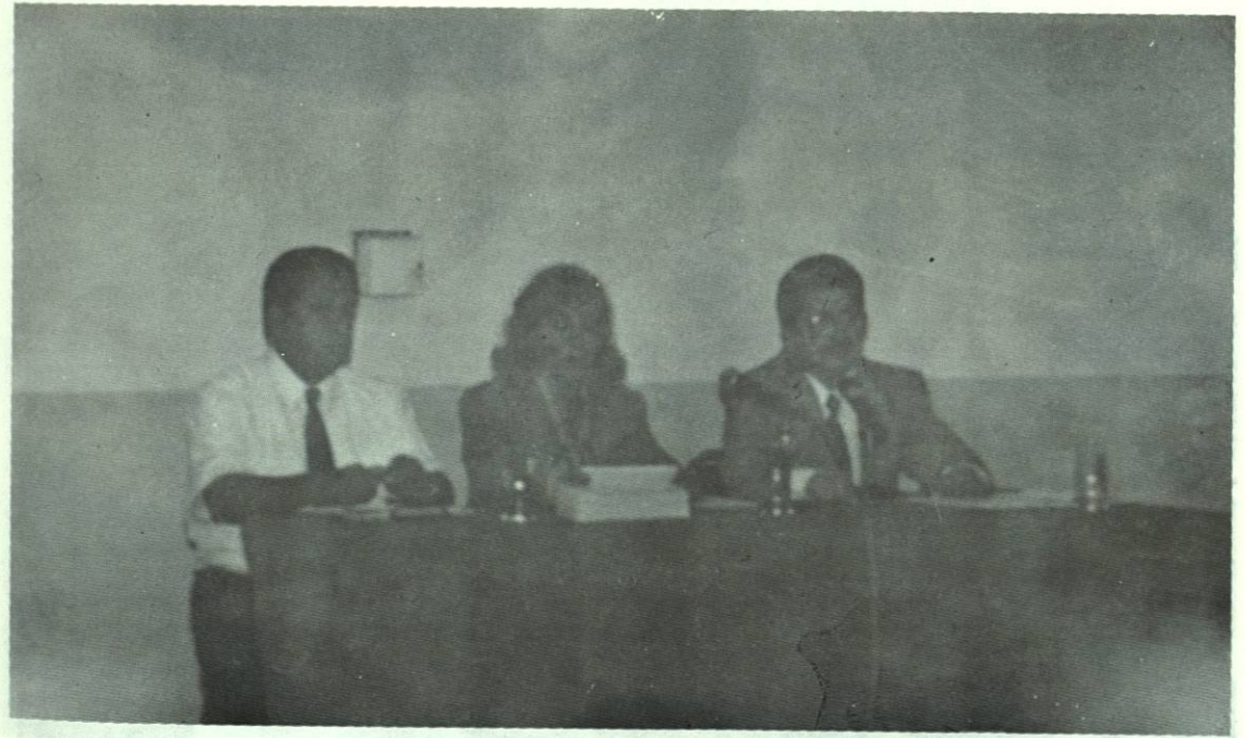
Conducción de la Junta de Maestros.