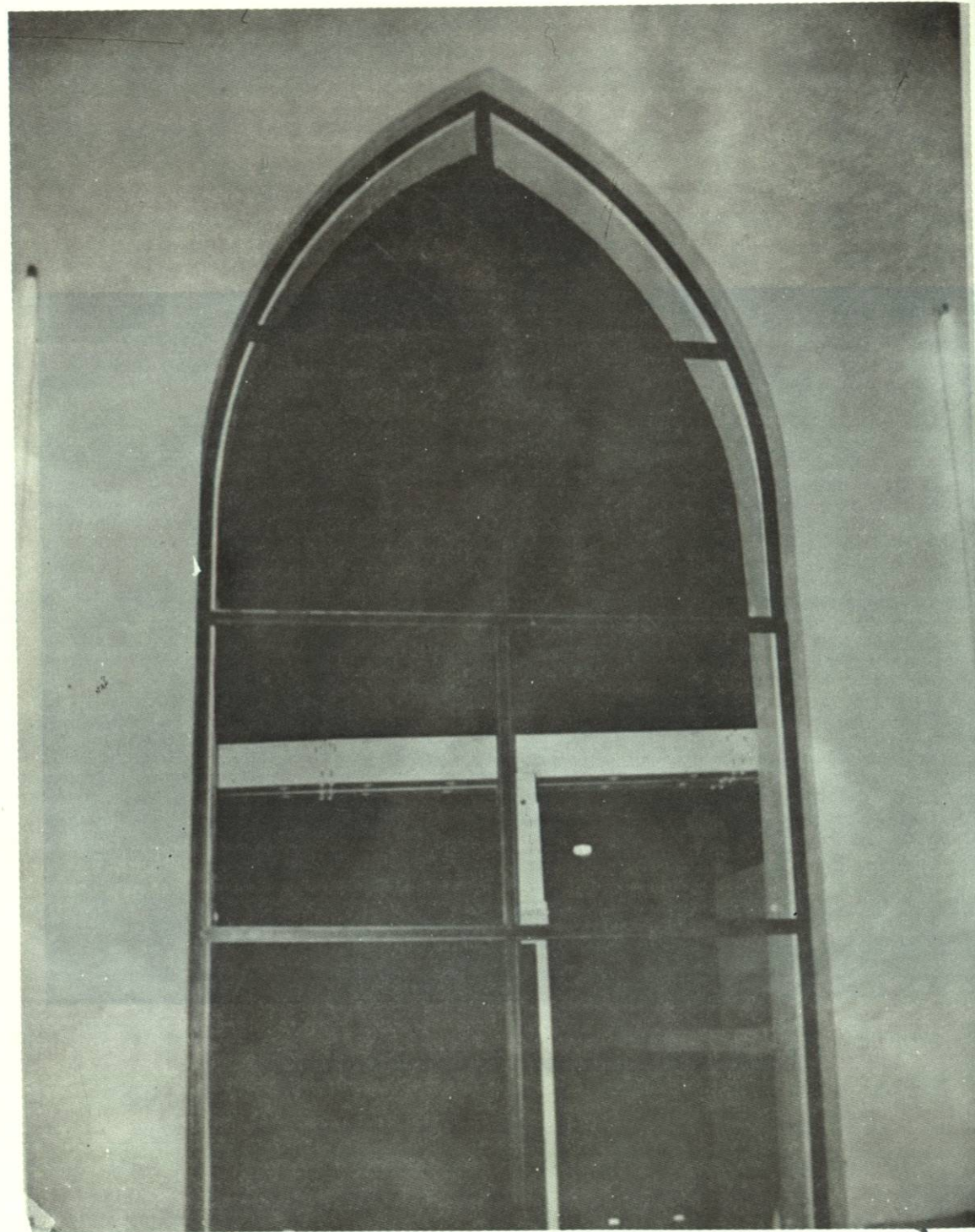
Inicio de los trabajos para instalar el vitral en el lado norte de edificio.