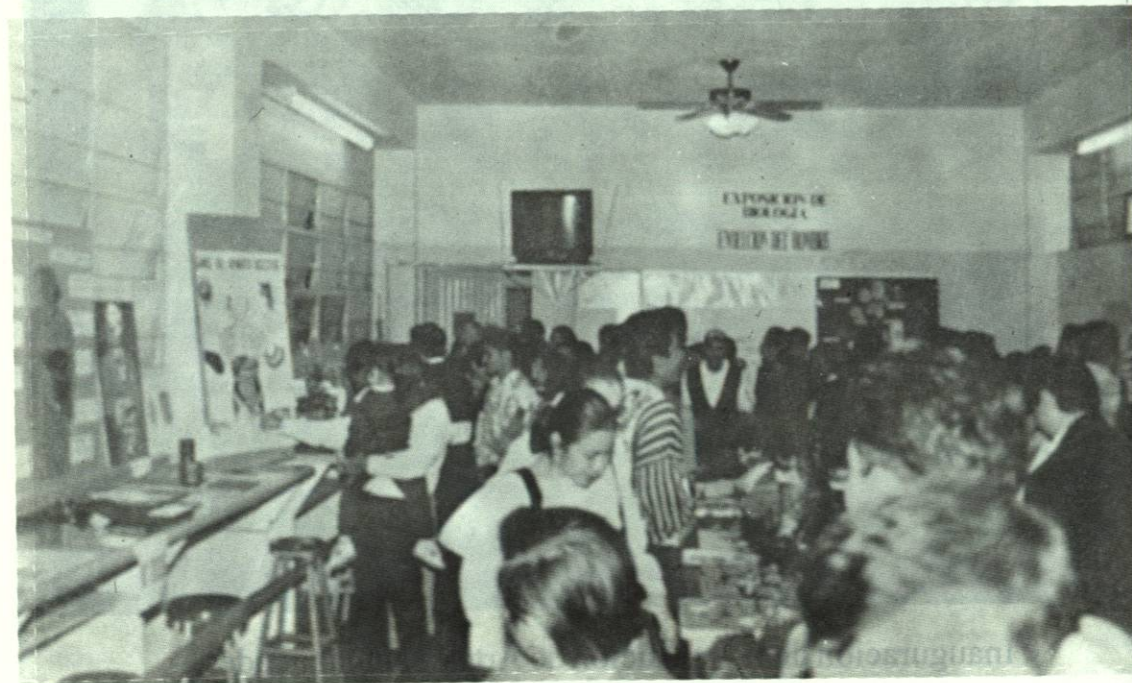
Alumnos recorriendo la Exposición.