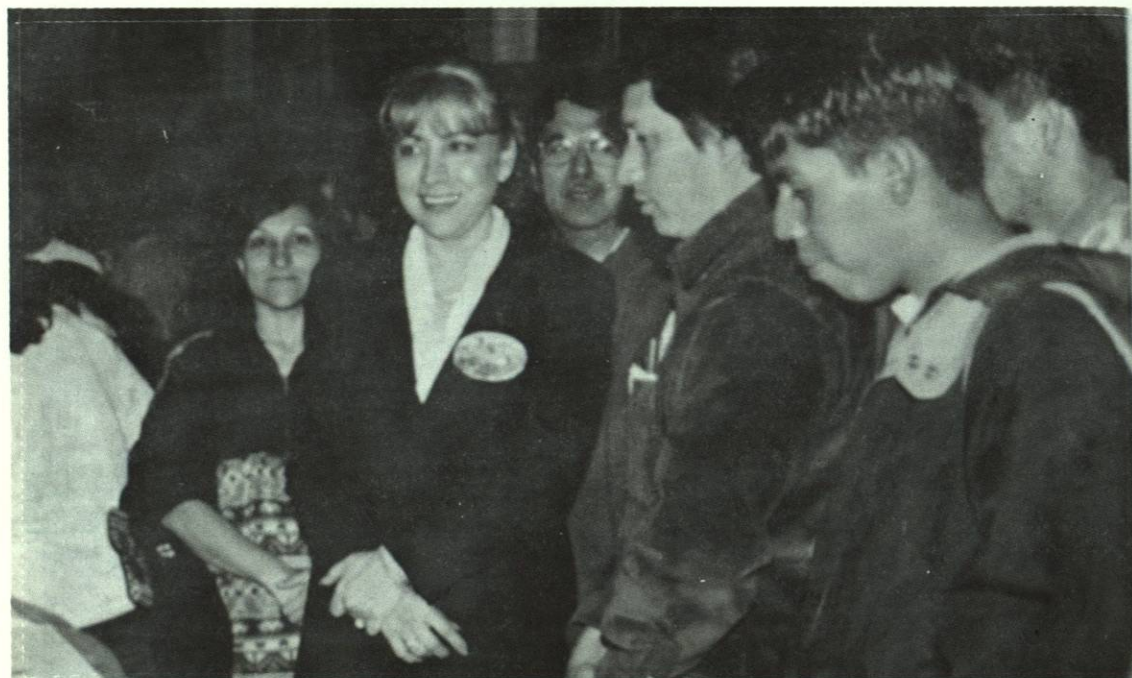
Maestros y alumnos presentando sus trabajos finales.