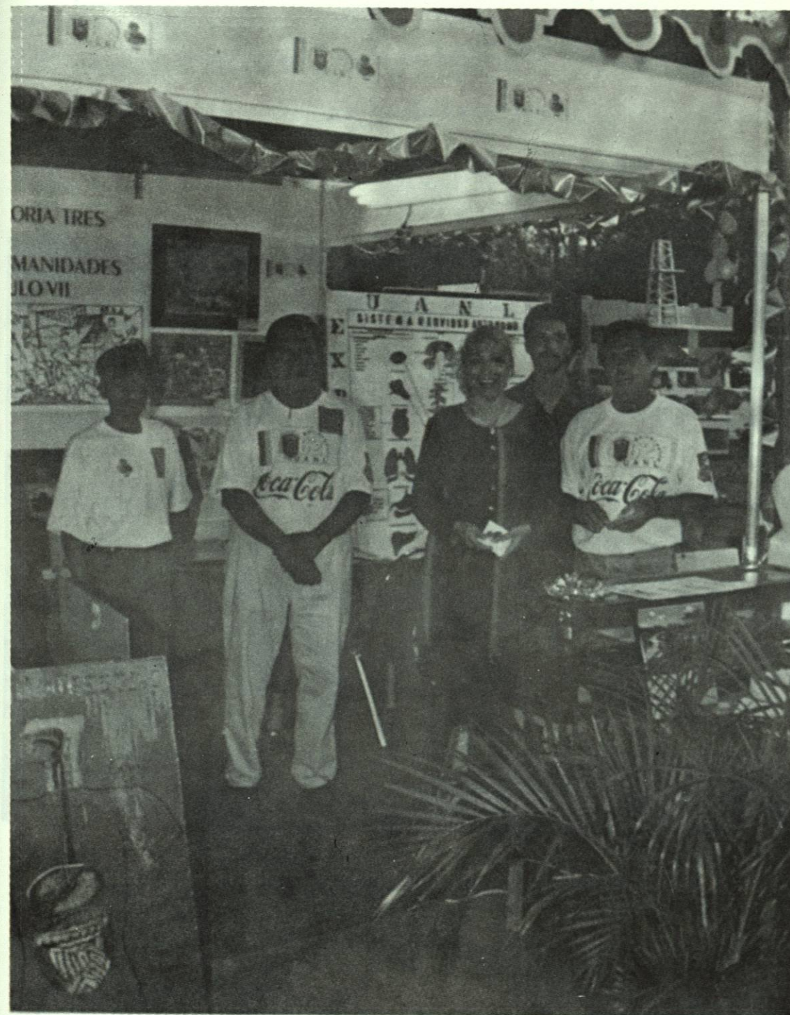
Participación en el II Festival de la Fraternidad Universitaria.