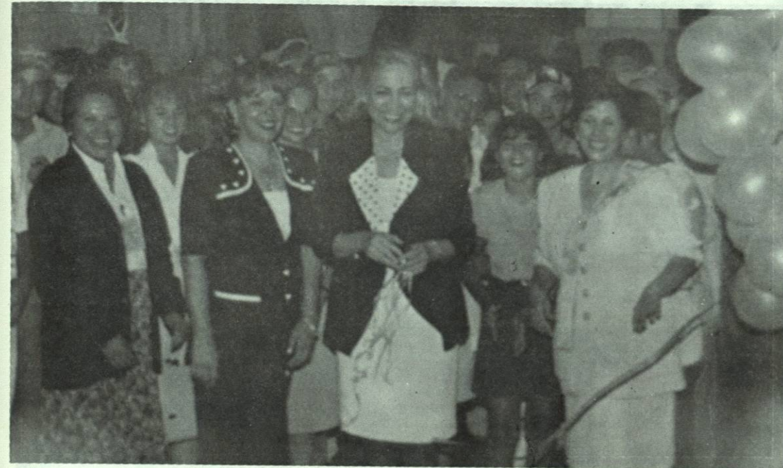
Exposición Física - Química semestre Septiembre - Enero 95 - 96