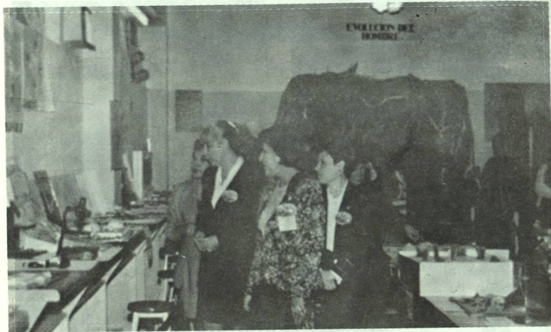
Exposición de trabajos finales de la Academia de Biología.