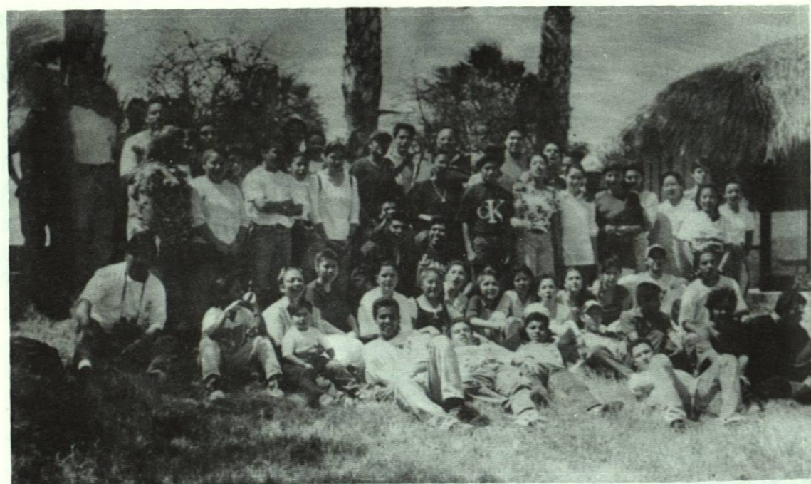
Visita a la "Hacienda de San Pedro" de la Universidad Autónoma de Nuevo León organizada para alumnos del 4º semestre.