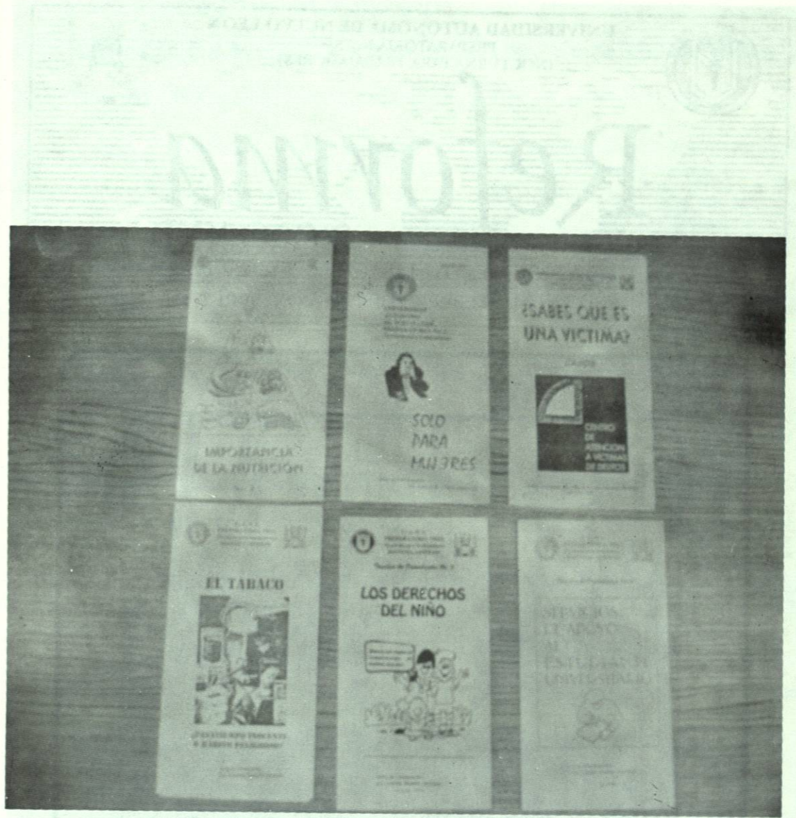
Publicaciones del Departamento Psicopedagógico de esta escuela.