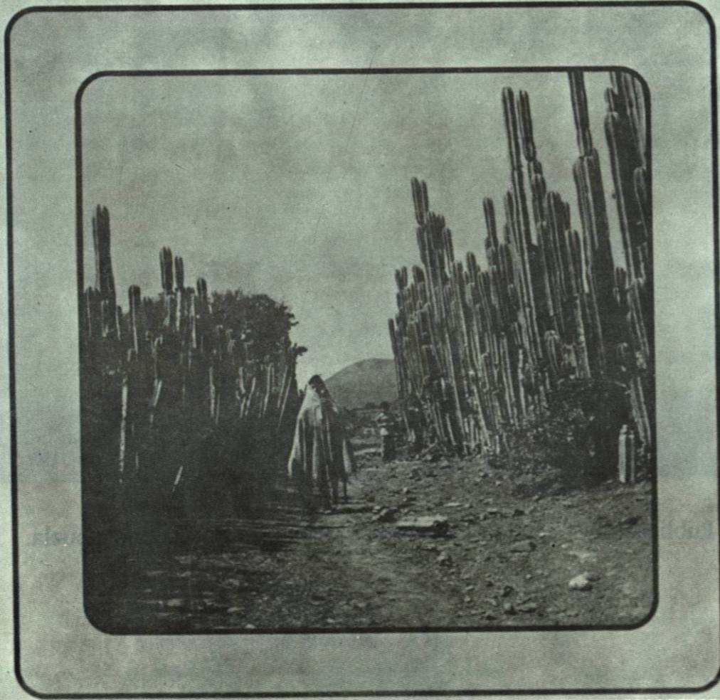
Órgano oficial de Difusión y Cultura de nuestra preparatoria (Edición Trimestral).