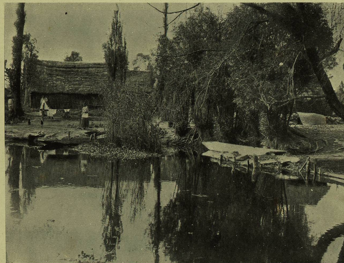
Santa Anita, Canal de la Viga.

This department has under its charge the collection of all federal taxes and imports, the purchase, sale, and management of all national property, all matters relative to institutions of credit and to the mints, the expenses of the federal administration, fiscal statistics, the public register of property, and everything pertaining to the commerce and the public debt of the Republic.