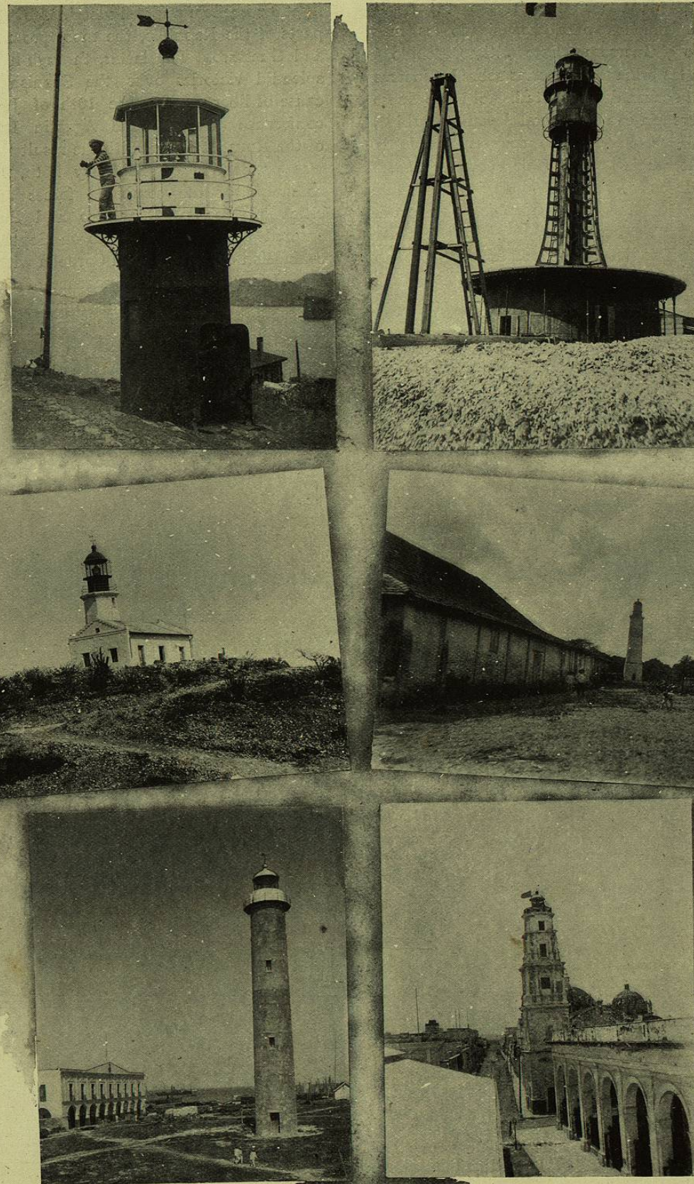
Algunos de los Faros de Mexico.—Departamento de la Secretaría de Comunicaciones y Obras Publicas. Some of the Lighthouses of Mexico.—Department of Communications and Public Works.

Congreso Constitucional y el 5 de Febrero del mismo año se promulgó la Constitución que rige á México hasta hoy. Aprobada la Constitución por el pueblo, fué Comonfort elegido Presidente y tomó posesión el 11 de Diciembre de 1857; pero mal aconsejado y sobretexo de que la Constitución era impracticable, disolvió el Congreso que acababa de reunirse, y se declaró dictador. Fué al fin derrotado y abandonó el país. Hizose entonces cargo del Gobierno de la República, el gran patriota Benito Juárez. De allí siguió la época de turbulencia promovida por la Reforma y la lucha por el poder entre liberales y conservadores. Durante este gran conflicto dictó el Presidente Juárez las célebres leyes de Reforma, dirigidas contra el Partido Clerical, destruyendo así su poder político.