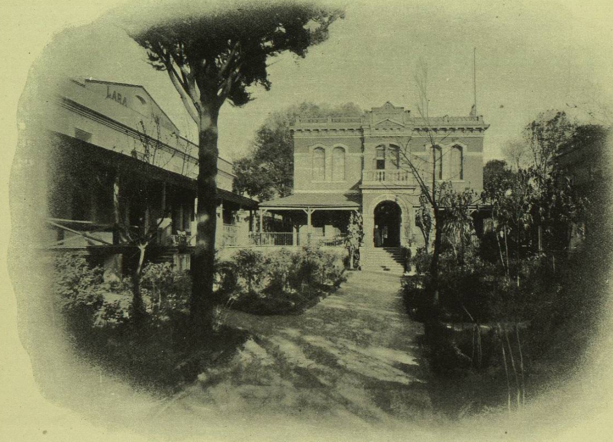
El Hospital Americano.