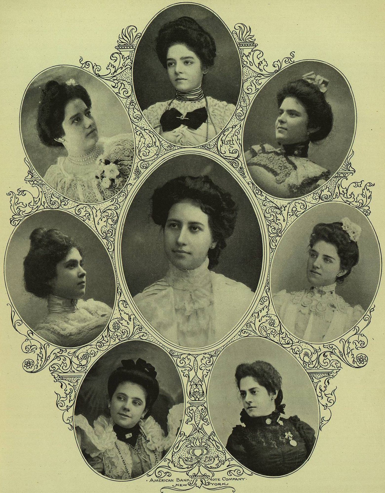
Señoritas Distinguidas de México.

The only cemetery existing in its primitive state is that of San Fernando, which contains the tombs of Juárez, Guerrero, Comonfort, Zaragoza, Miguel Lerdo de Tejada, Melchor Ocampo, General Tomás Mejía, who was shot at the side of Maximilian, and other notable personages. It is a veritable National Pantheon, and