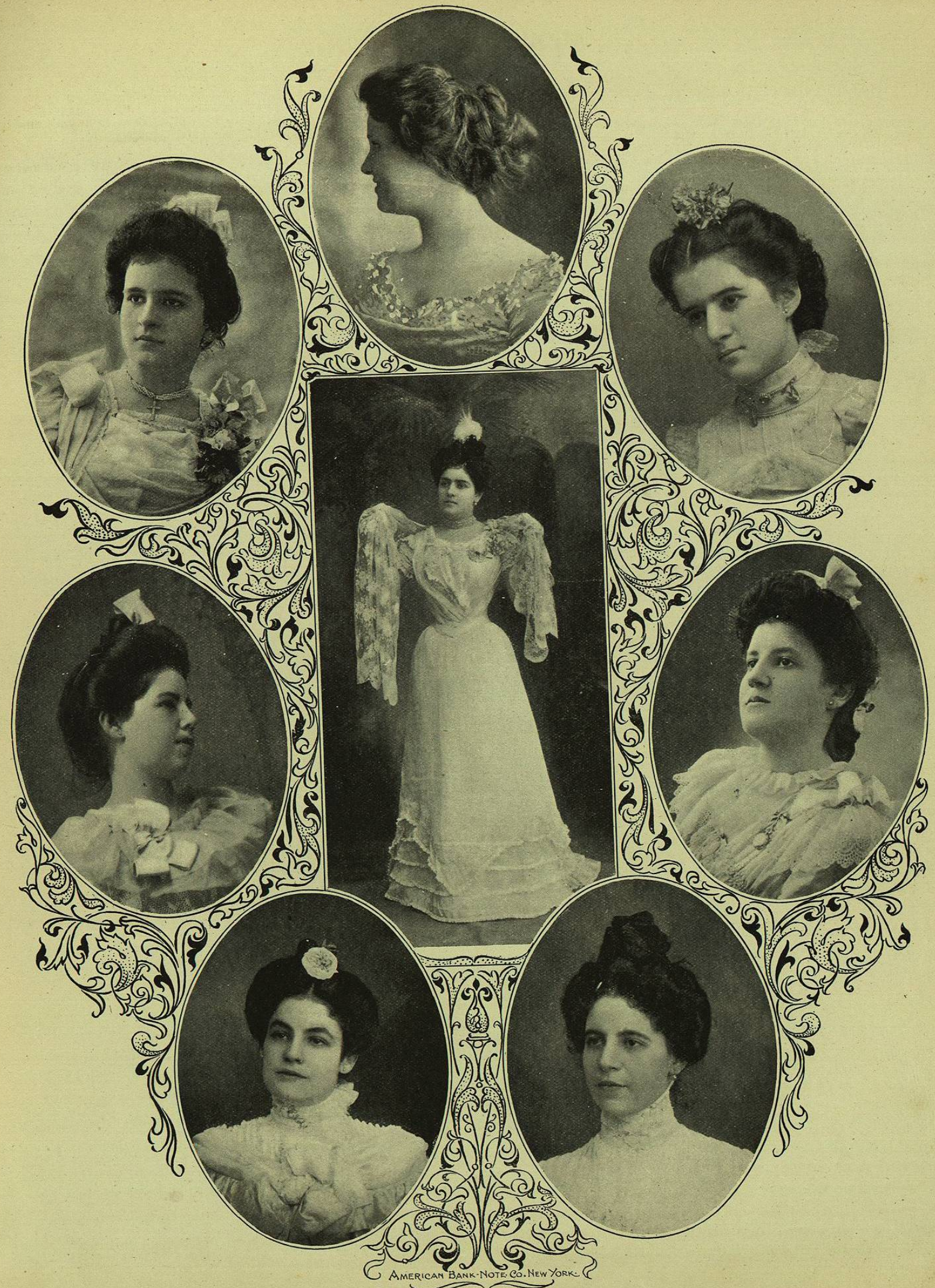
Señoritas Distinguidas de México.

The Institution received substantial support from the start, the members of railroad associations in the southwest donating a sum of $1500; the Mexican Central and the Mexican National Railroads contribute $100 a month towards its support.