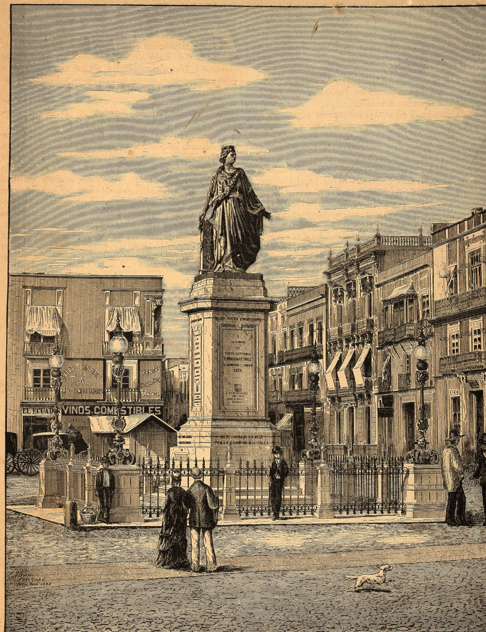
MONUMENTO A ENRICO MARTINEZ.

(Plazuela del Seminario, Ciudad de México.)