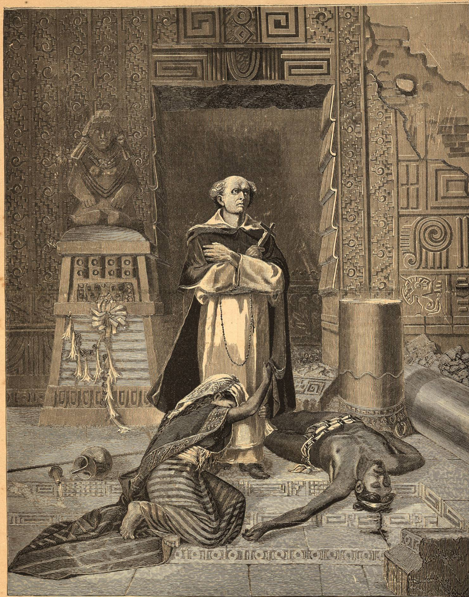
EL OBISPO LAS CASAS.